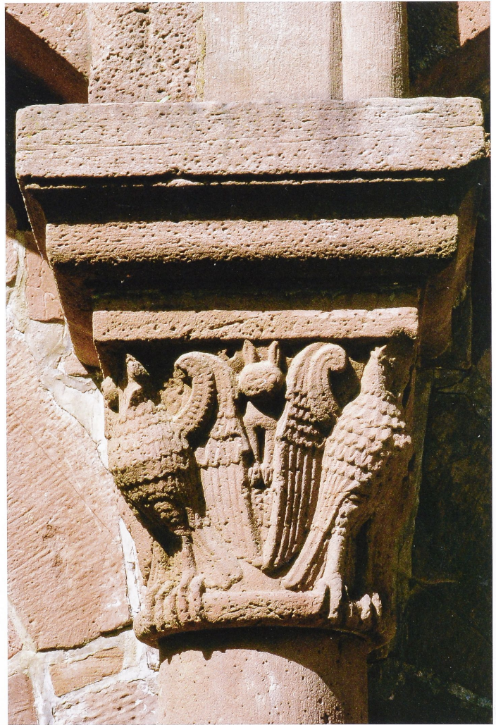
3 Stauferzeitliches Adlerkapitel in der Pfalz Gelnhausen, Torhalle, um 1180

Neben die Herrschaft von Königen, Bischöfen, Äbten und Fürsten schoben sich seit der ausgehenden Salierzeit die selbstbewussten Stadtkommunen. Die Bürger von Worms und Speyer erlangten