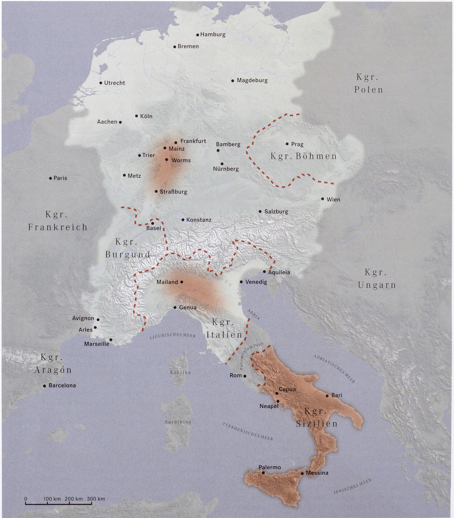
2 Das Reich der Stauer und die Innovationsregionen an Rhein-Main-Neckar, in Oberitalien und im Königreich Sizilien