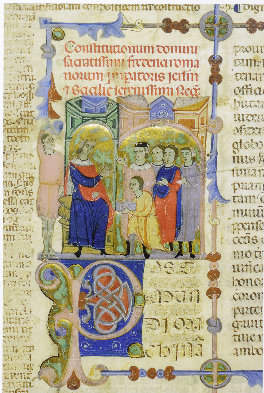
4 Übergabe des Liber Augustalis an Kaiser Friedrich II., Ausschnitt aus einer Handschrift des Liber Augustalis, 2. Hälfte 13. Jahrhundert, Vatikanstadt, Biblioteca Apostolica Vaticana, Cod. Reg. lat. 1948, fol. 4r

göttliche Weltordnung zurück. Die Vorrede zum sizilianischen Gesetzeswerk von 1231 verwies auf den menschlichen Sündenfall, aus dem Herrschaft zur Eindämmung des Unrechts erwachsen sei. Wenn die kaiserliche Macht Frieden und Gerechtigkeit gewährleiste, könnten die Menschen den Weg zur bewahrenden göttlichen Ordnung beschreiten. Göttlicher Auftrag und staufische Vollgewalt ergänzten sich.