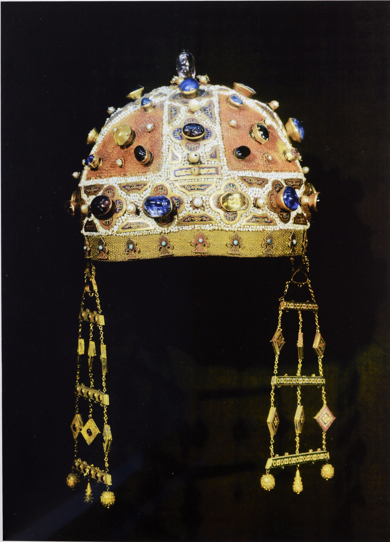
5 Haubenkrone (Kamelaukion), die im Grab der ersten Gemahlin Friedrichs II., Konstanze von Aragón, gefunden wurde. Palermo, um 1220–1222, Palermo, Tesoro della Cattedrale