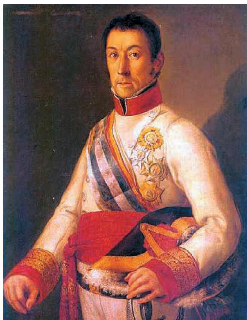
Don Francisco Javier de Elío y Olondriz, último Virrey del Río de la Plata Óleo de don Miguel Parra (1780-1846) en el Museo de Bellas Artes de Valencia