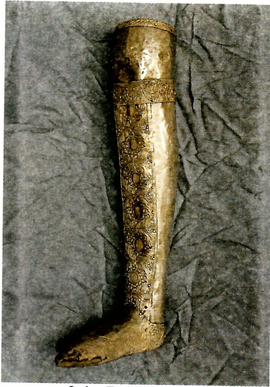
Slika 1. Moćnik noge sv. Luke Evangelista, srebro, iskucano i pozlačeno, XV. stoljeće, katedrala u Dubrovniku