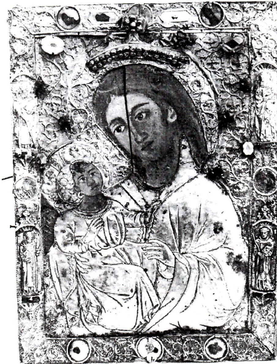
Slika 3. Srebreni okov Gospe od Jezera, srebro iskucano, emajl i kamenje, druga polovica XIV. stoljeća, Župni ured Babino Polje na Mljetu