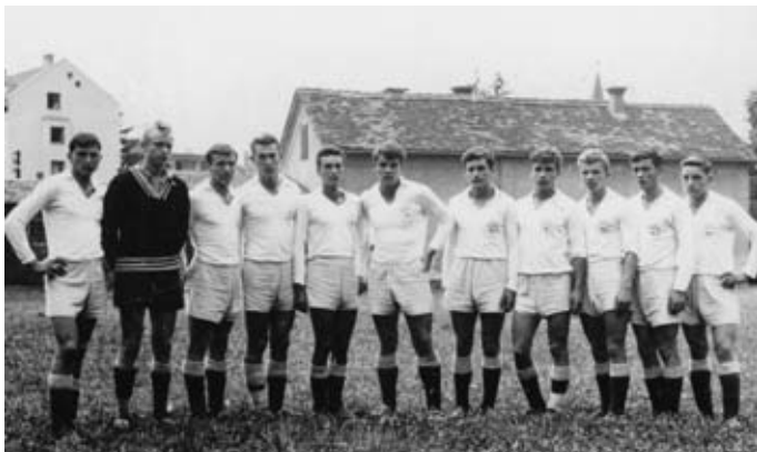
Člani mladinske ekipe Nogometne zveze Maribor, leta 1959.