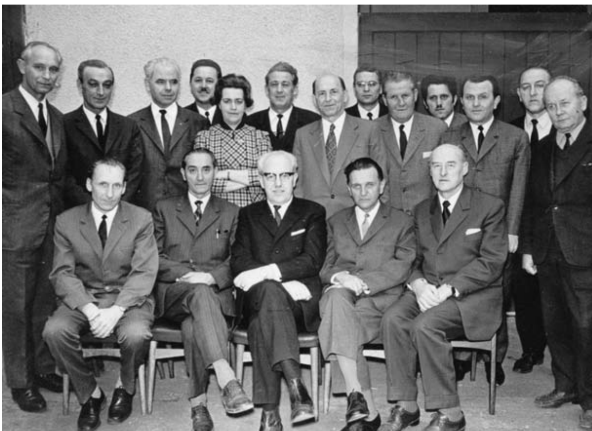
Člani Nogometne podzveze Maribor, leta 1971.

Disciplinska komisija NZ Jugoslavije je kaznovala Branik s 6-mesečno prepovedjo igranja, Harlovac je postal drugoligaš, naslednji dan (11. avgusta 1960) pa je Upravni odbor MŠD Branik razpustil nogometni klub Branik.