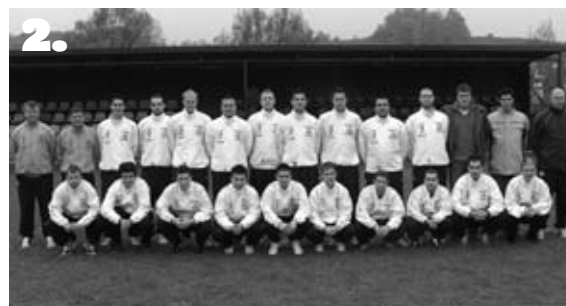
Slike: 1. NK Peca 2. NK Tehnotim Pesnica