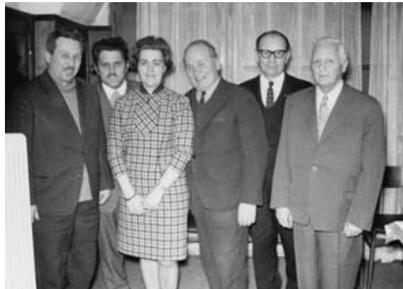
Tekmovalna komisija NPM, leta 1971.

V obdobju po letih 1958 – 1960 se je večina klubov preimenovala, mnogi pa so bili tudi na novo ustanovljeni – tako se je podzveza razširila od 14 na 30 in več klubov, ki so tekmovali v različnih ligah podzveze Maribor. Zaradi razvoja in ustanavljanja vedno novih klubov so se osamosvojile nove podzveze; tako so iz mariborske nogometne podzveze nastale: celjska, murskosoboška (od nje nato samostojna lendavska) in ptujška nogometna podzveza (1978).