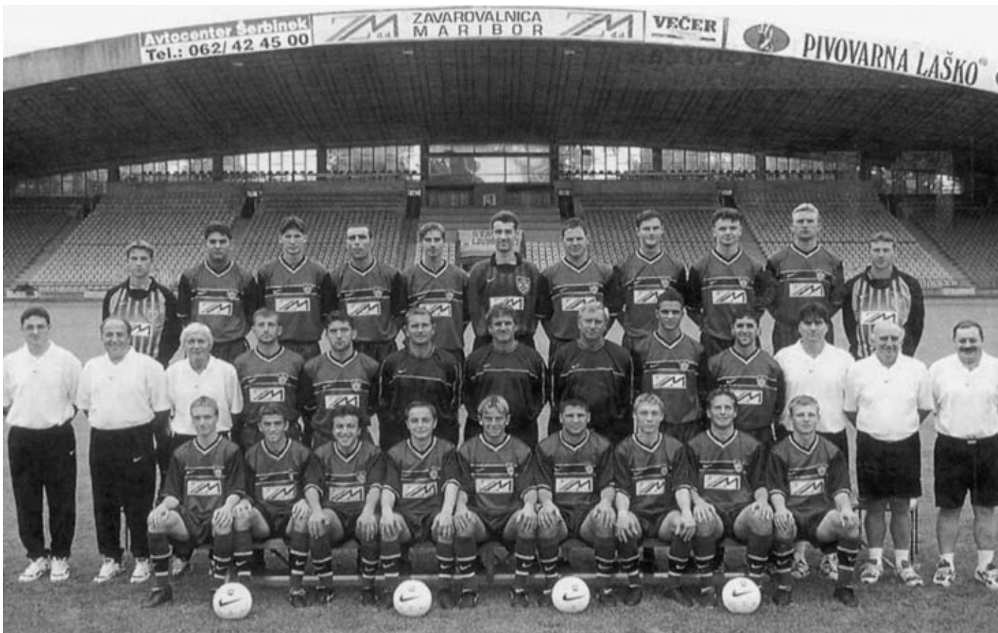
Nogometaši Maribora Pivovarne Laško s strokovnim vodstvom v sezoni 1998/1999, v kateri so dosegli zgodovinski uspeh mariborskega in slovenskega nogometa.

največji KLUBSKI NOGOMETNI USPEH JE DOSEGLI NK MARIBOR, KO JE 28. 8. 1999 PREMAGAL LYON IN SE UVRSTIL V LIGO PRVAKOV.