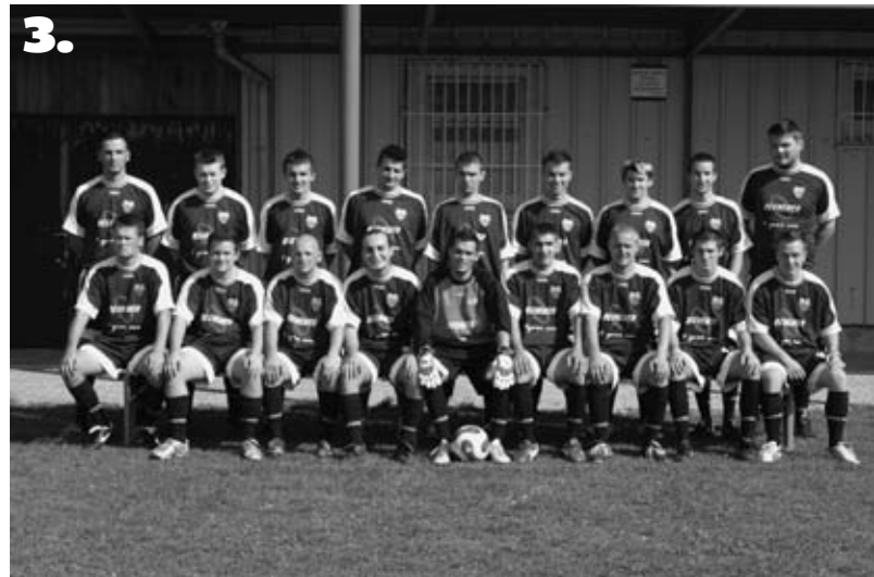
Slike: 1. ŠD Marjeta 2. NH Mislinja 3. NH Miklavž