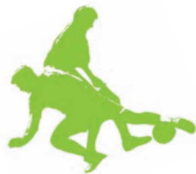
Prvič državni prvaki 1997/98.