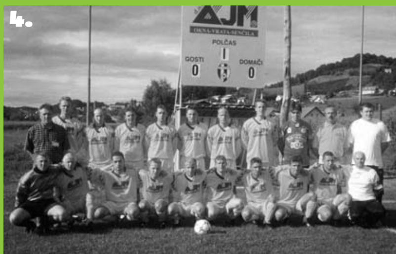
Slike: 1. FK Inter Jakob 2. FK Jarenina 3. FK Jurovski Dol 4. FK Hungota