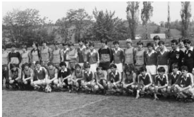
Udeleženci turnirja mladinskih ekip, leta 1987.

Z območja mariborske podzveze (pozneje medobčinske nogometne podzveze) so v I. jugoslovanski nogometni ligi tekmovali NH Nafta (1946/47) in najuspešnejši nogometni klub MNZ Maribor NH Maribor – Branik, ki je bil član II. zvezne lige (1961/62 – 1966/67), nato pa je v sezonah 1967/68 do 1973/74 igral v I. zvezni ligi. Po izpadu je igral v II. zvezni ligi in nato v Medrepubliški ligi – zahod. V II. zvezni ligi je sodeloval tudi NH Aluminij (1967/68 – 1968/69).