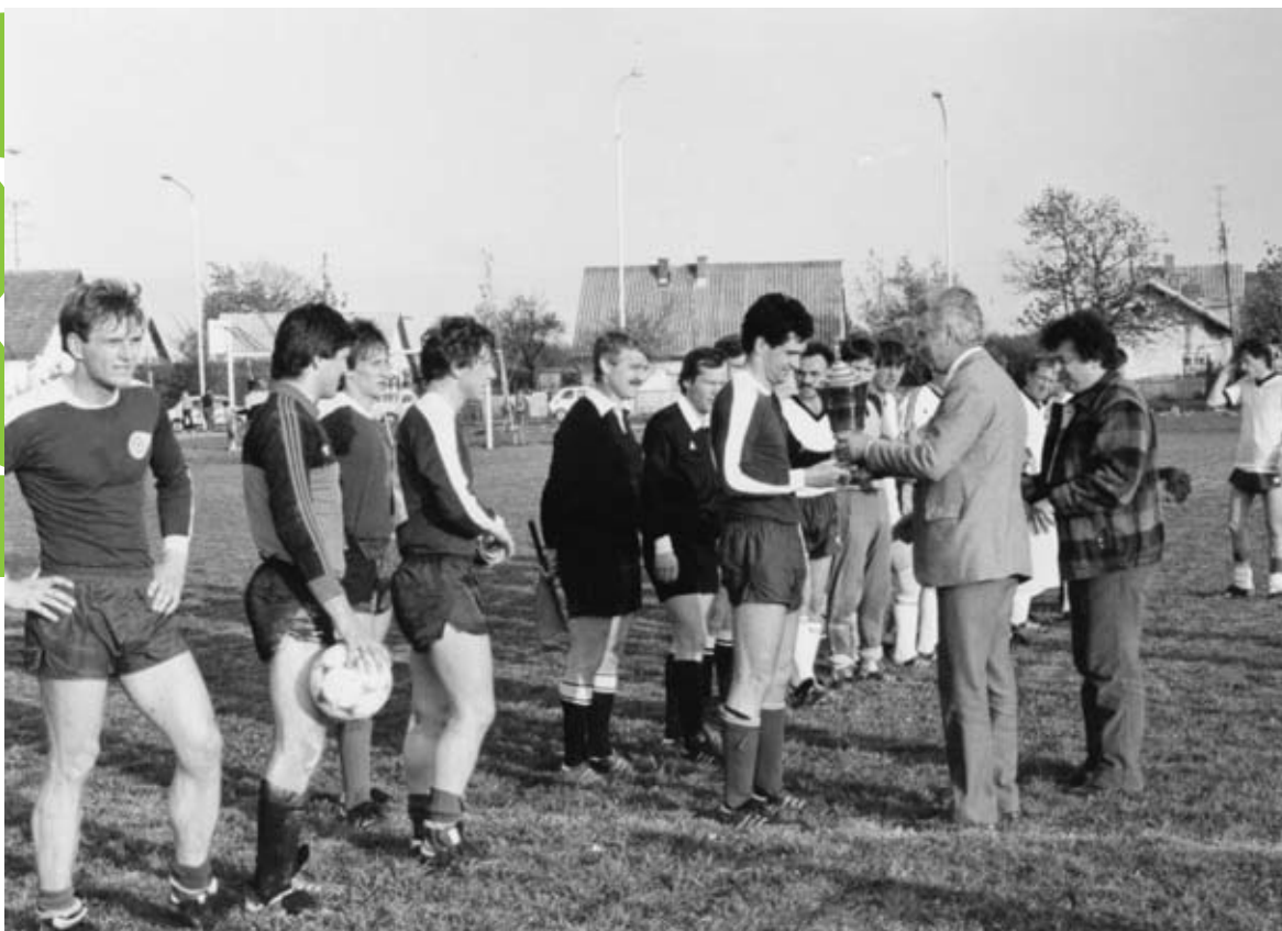
Podelitev pokala zmagovalcu pokalnega tekmovanja MNZ Maribor v TS 1980/1981.