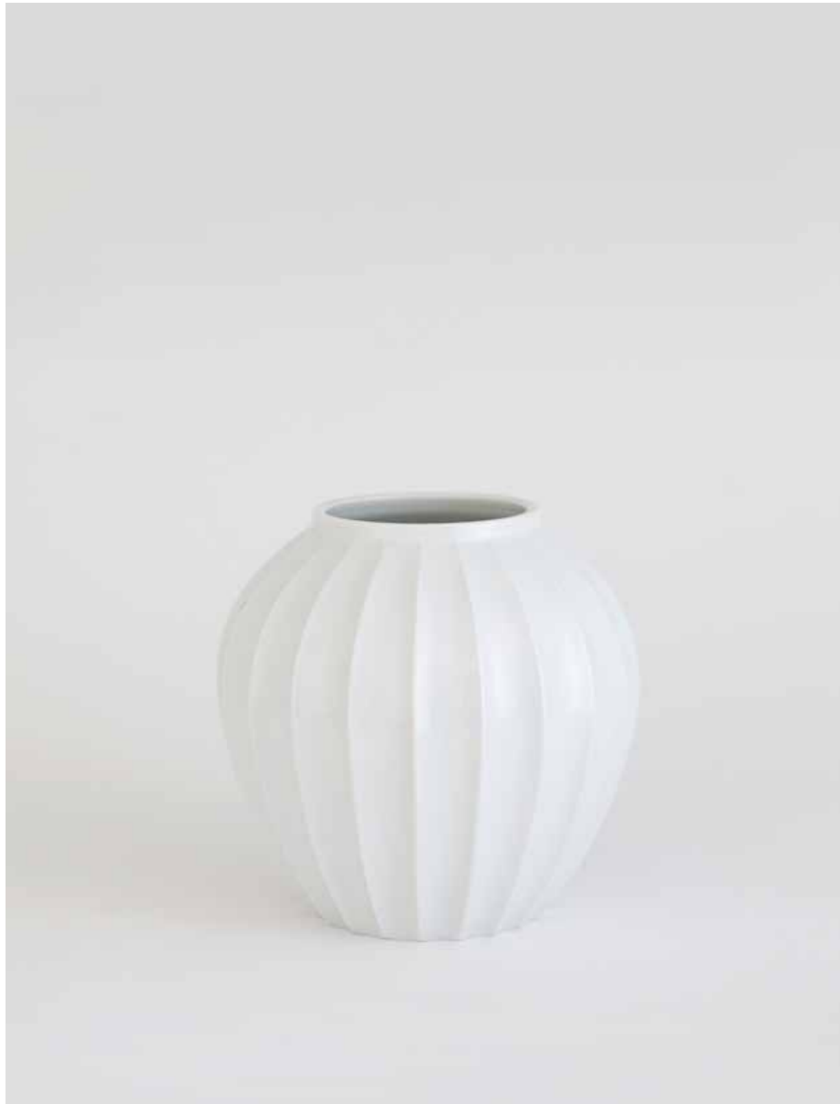
Porcelain Corrugated Jar 백자 홈파기 항아리 2017 2017 Porcelain, transparent glaze 백토, 투명 유약, 환원 소성 Reduction firing 23(ø)X23(h)cm 23(ø)X23(h)cm