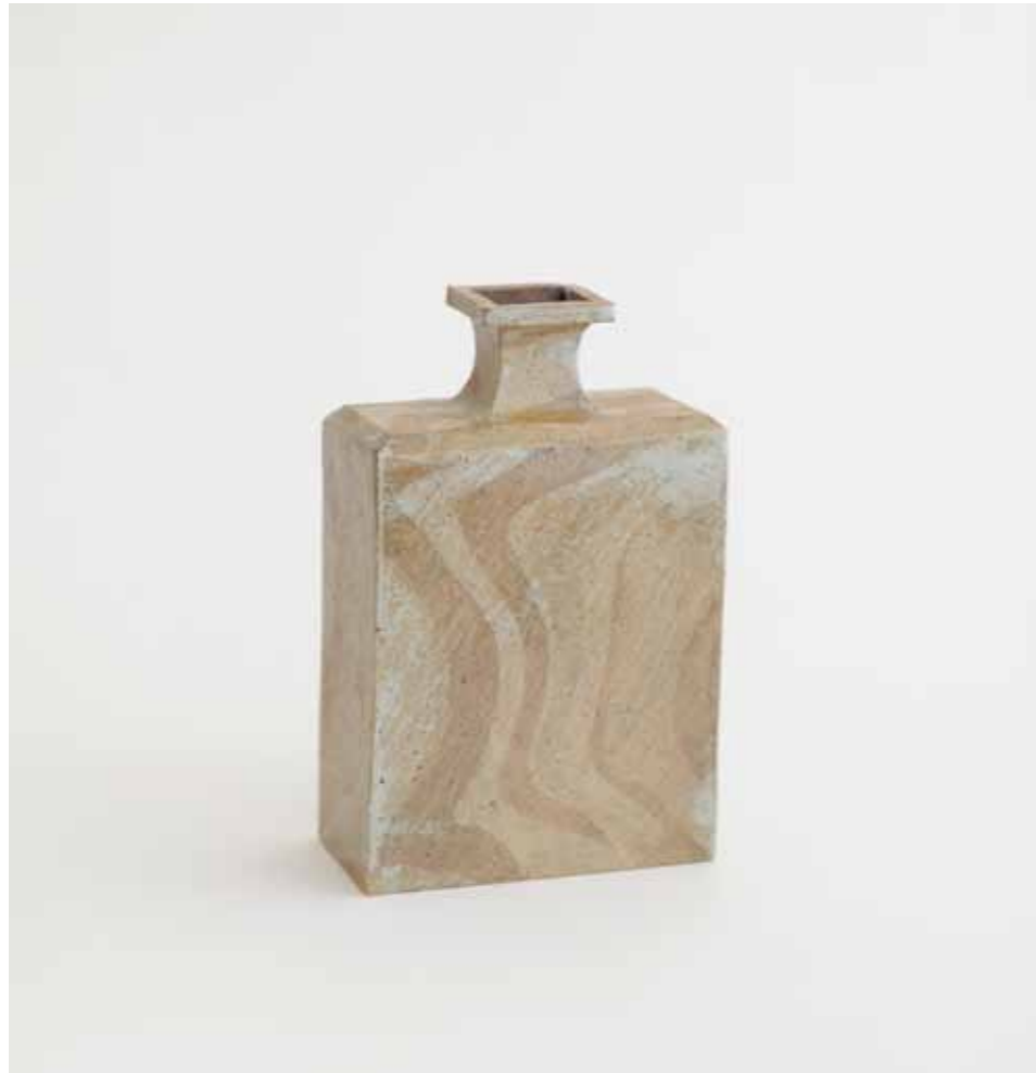
Yeollinmun Ash Glaze Bottle 1982 Stoneware inlaid in the yeollinmun (mixing of different clay bodies) technique under ash glaze Reduction firing 13.4X7X21(h)cm