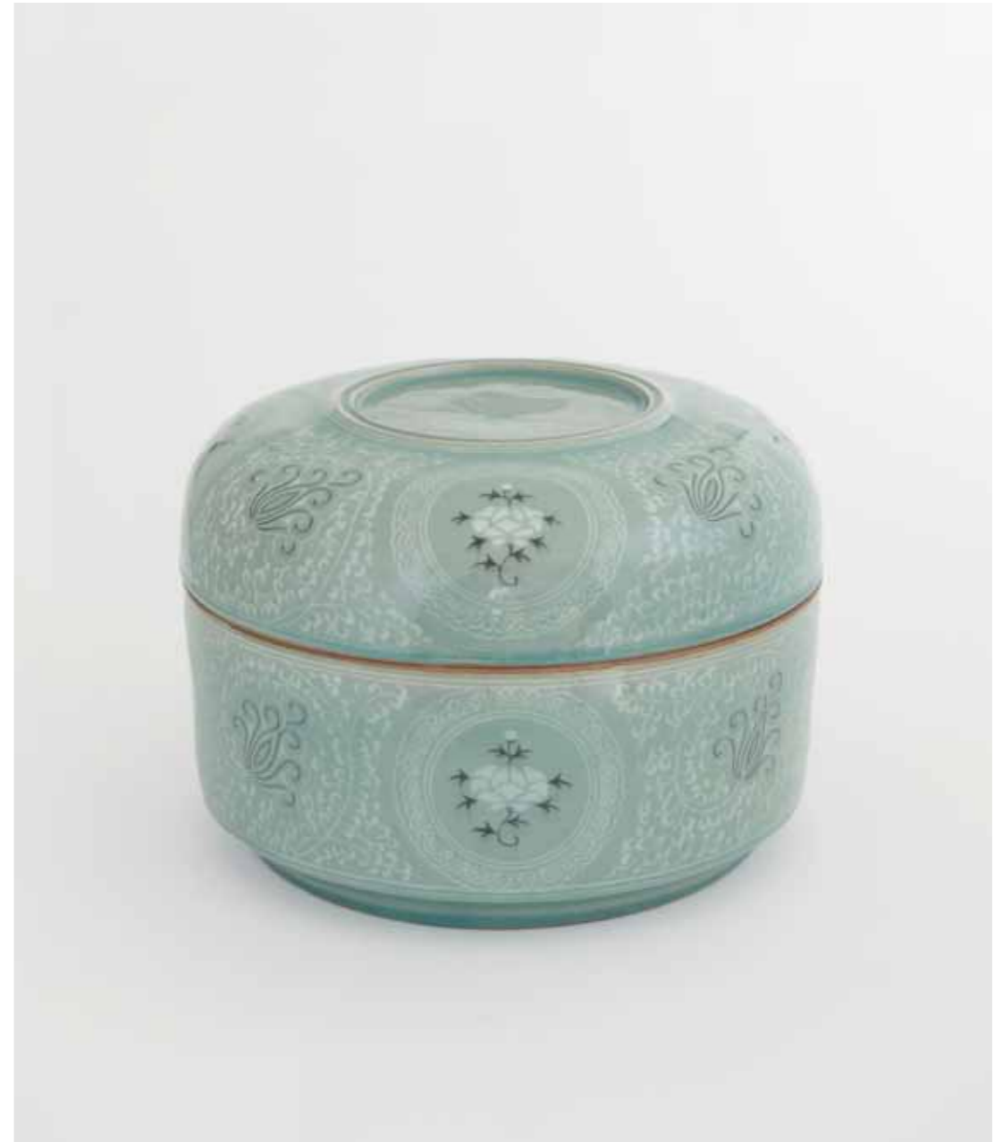
Celadon Container 2012 Stoneware with inlaid decoration under celadon glaze Reduction firing 35(ø)X25(h)cm