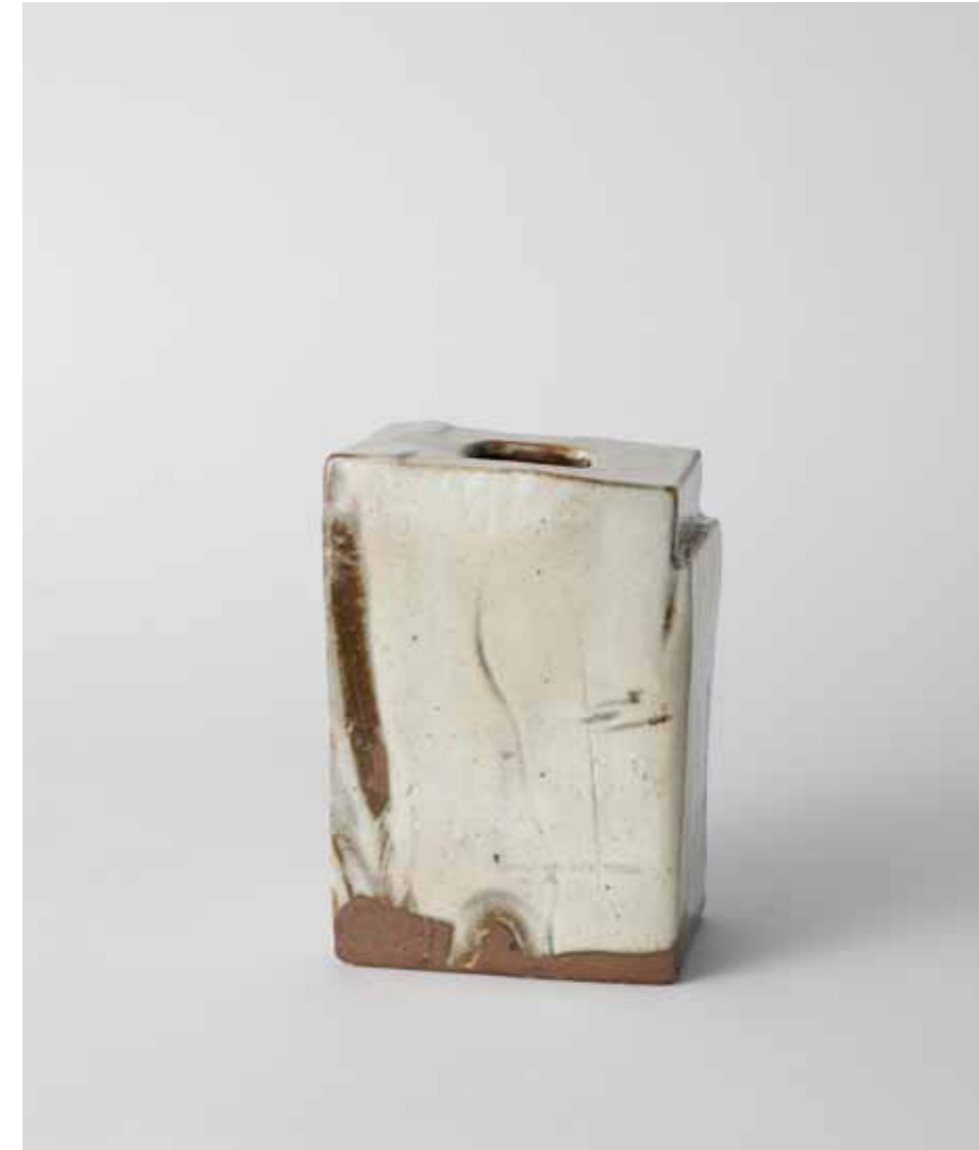
Buncheong Rectangular Bottle 2010 Stoneware covered with white slip and marks made with finger and duck decoration under transparent glaze Reduction firing 11.5X7X17(h)cm

분청 면취 호 2010 수화문 장식, 분장 기법 분청토, 화장토, 투명 유약, 환원 소성 17(o)X16.5(h)cm