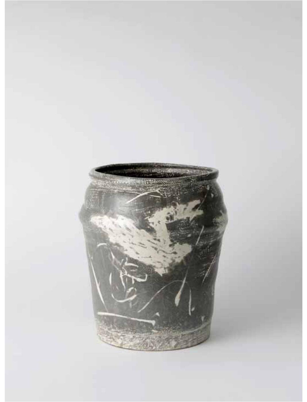
Predream Series 1991 Stoneware with stamped and inlaid decoration using white slip under transparent glaze Reduction firing 28(ø)X32(h)cm