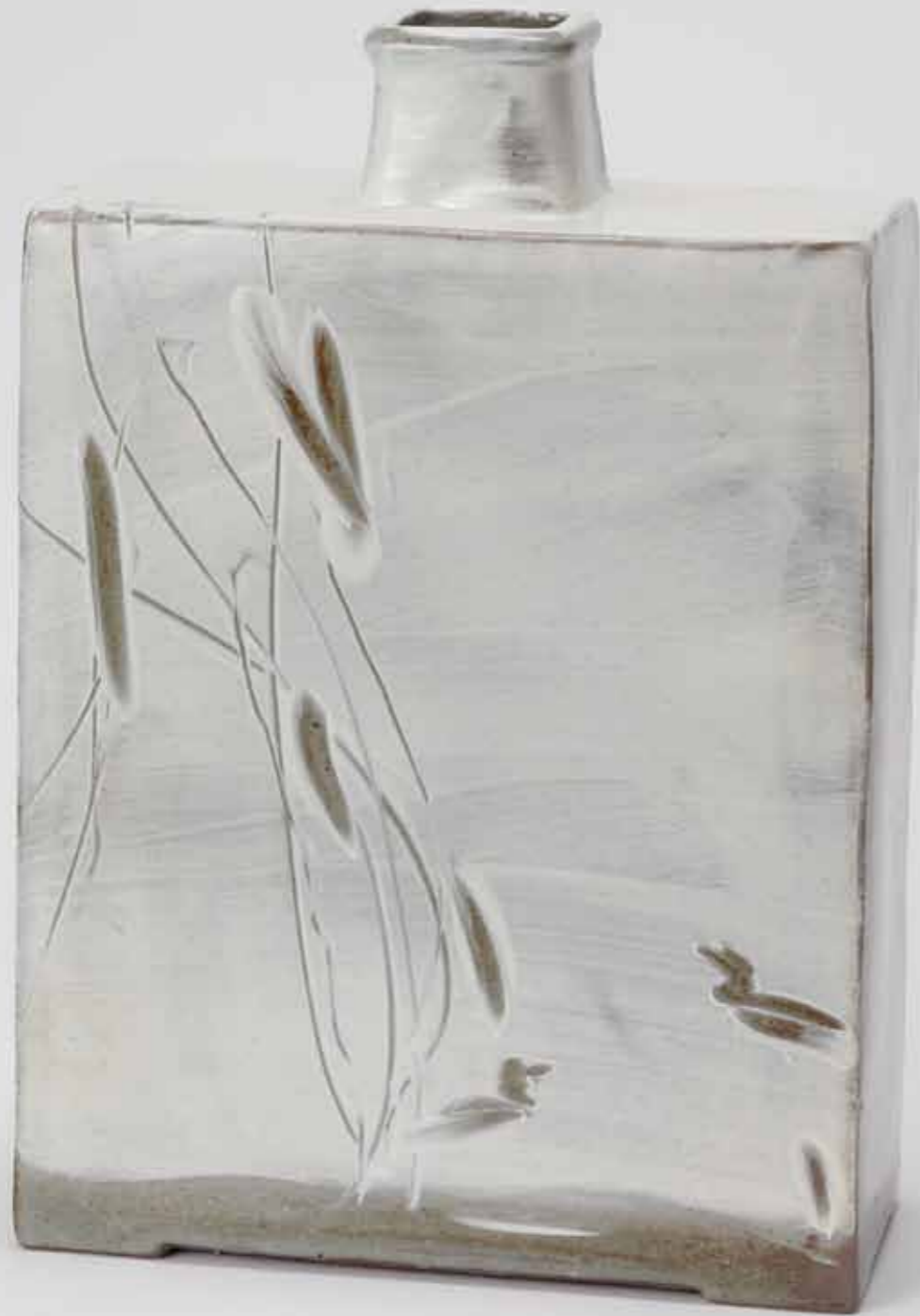
Buncheong Jar 2017 Stoneware covered with white slip and marks made with finger and duck decoration under transparent glaze Reduction firing 20×8.5×29.5(h)cm