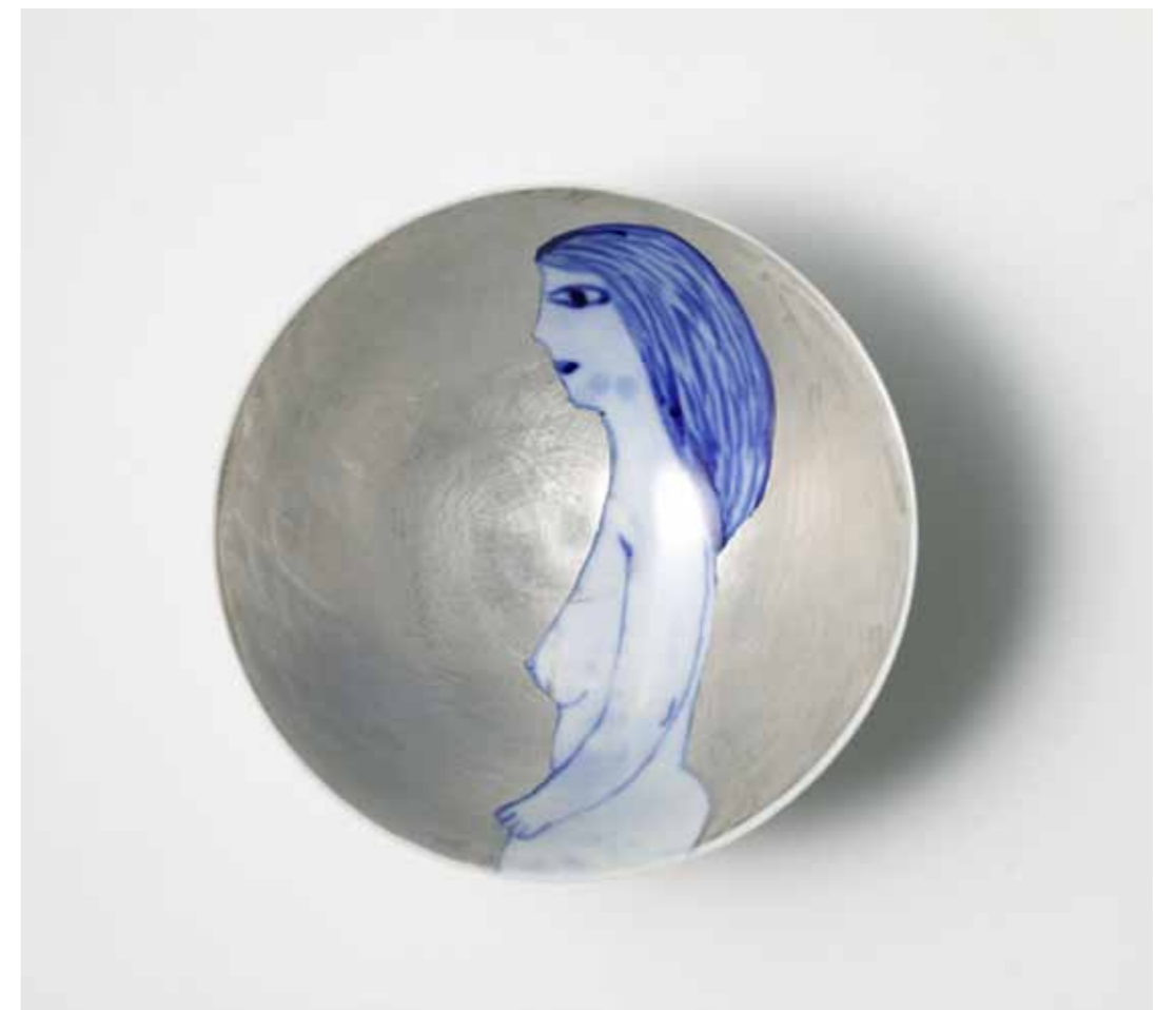
Bowl with Illustration 2017 Decorated bowls and cups in porcelain, transparent glaze decorated with cobalt oxide and silver leaf Reduction firing 10(ø)X9(h)cm