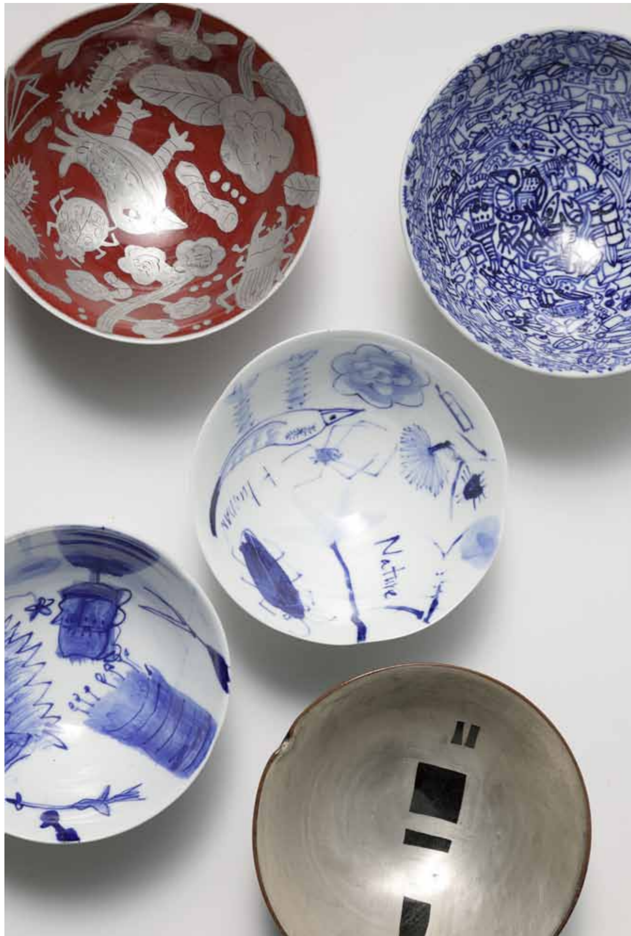
Bowls with Different Decorations 2017 Decorated bowls and cups in porcelain, transparent glaze decorated with cobalt oxide, cinnabar and silver leaf Reduction firing 10(ø)X9(h)cm-14(ø)X10(h)cm