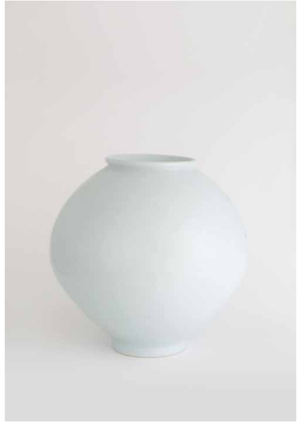
Porcelain Moon Jar 2010 Porcelain, transparent glaze Reduction firing 40(ø)X42(h)cm 백자 달항아리 2010 백토, 투명 유약, 환원 소성 40(ø)X42(h)cm