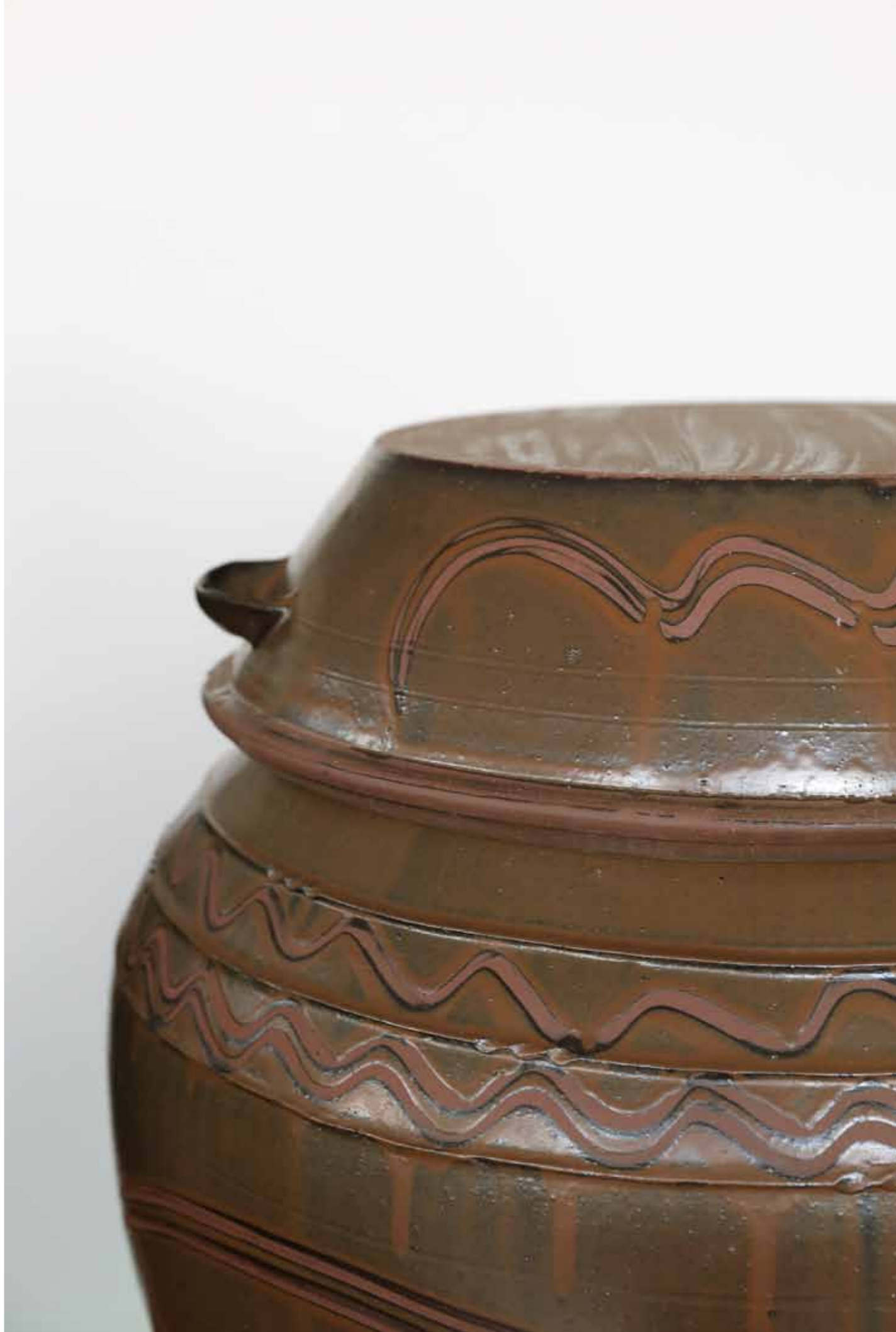
옹기물항 2016 수화문 장식 옹기토, 재유, 환원 소성 70(ø)X73(h)cm