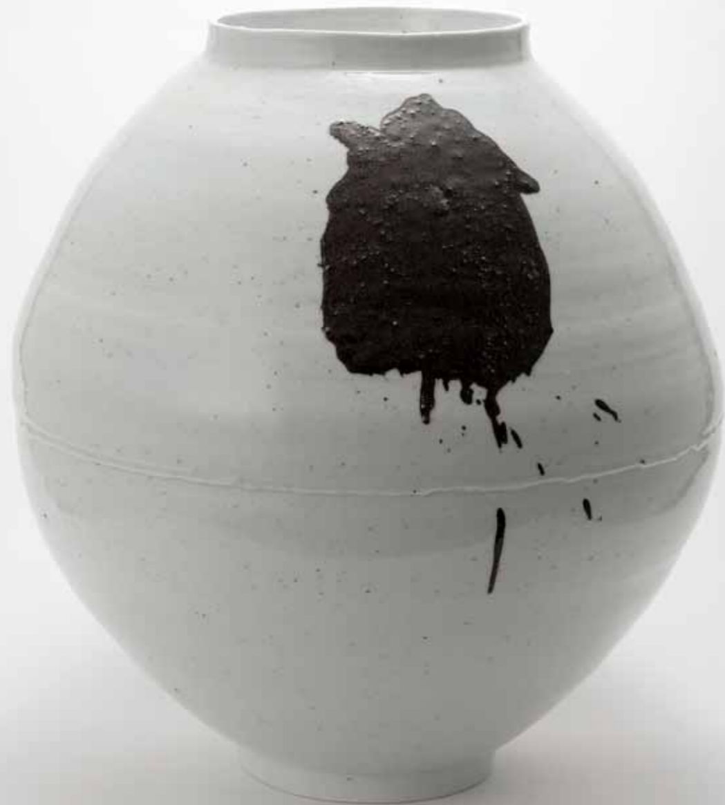
철화 백자 항아리 2015 철화 장식 백토, 산화철, 투명 유약, 환원 소성 44(ø)X48(h)cm