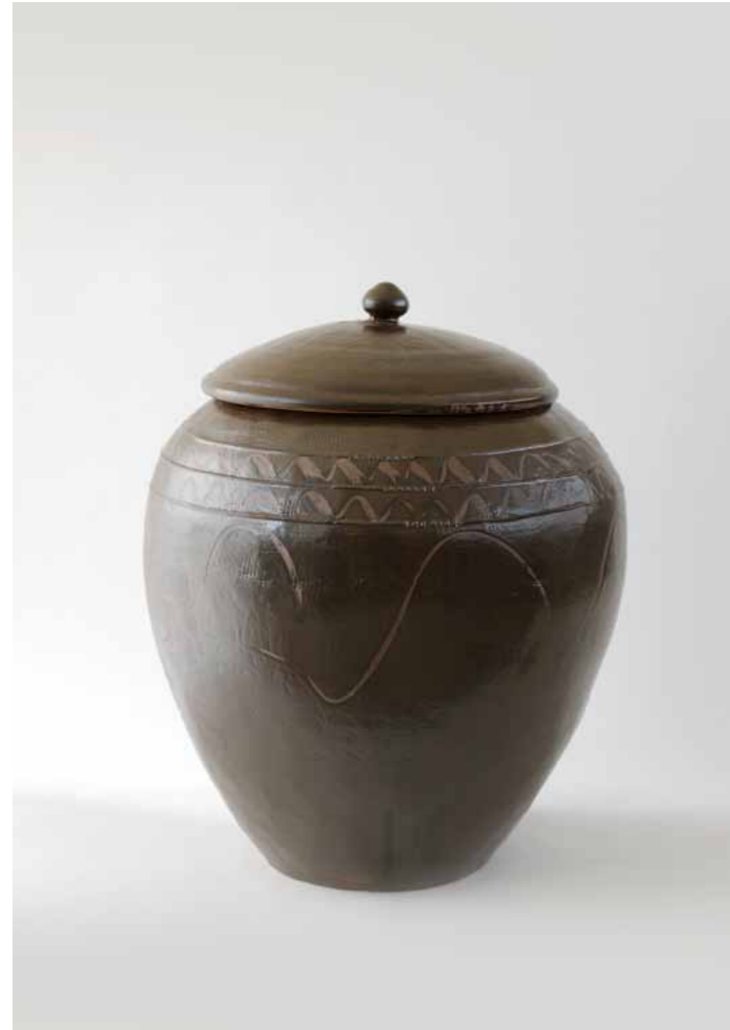
Onggi Jar with Lotus-bud Lid 2017 Onggi clay, ash glaze, finger drawn zigzag decoration Reduction firing 70(ø)X83(h)cm