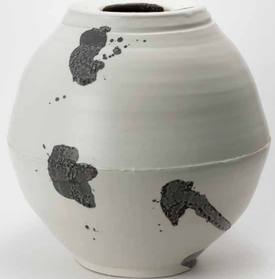
철화 백자 항아리 2014 철화 장식 백토, 산화철, 투명 유약, 환원 소성 45(ø)X45(h)cm