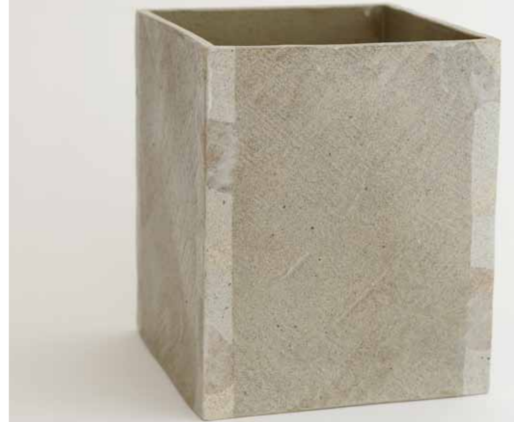
Yeollinmun Ash Glaze Vessel 2014 Stoneware inlaid in the yeollinmun (mixing of different clay bodies) technique under ash glaze Reduction firing 22X22X32.5(h)cm