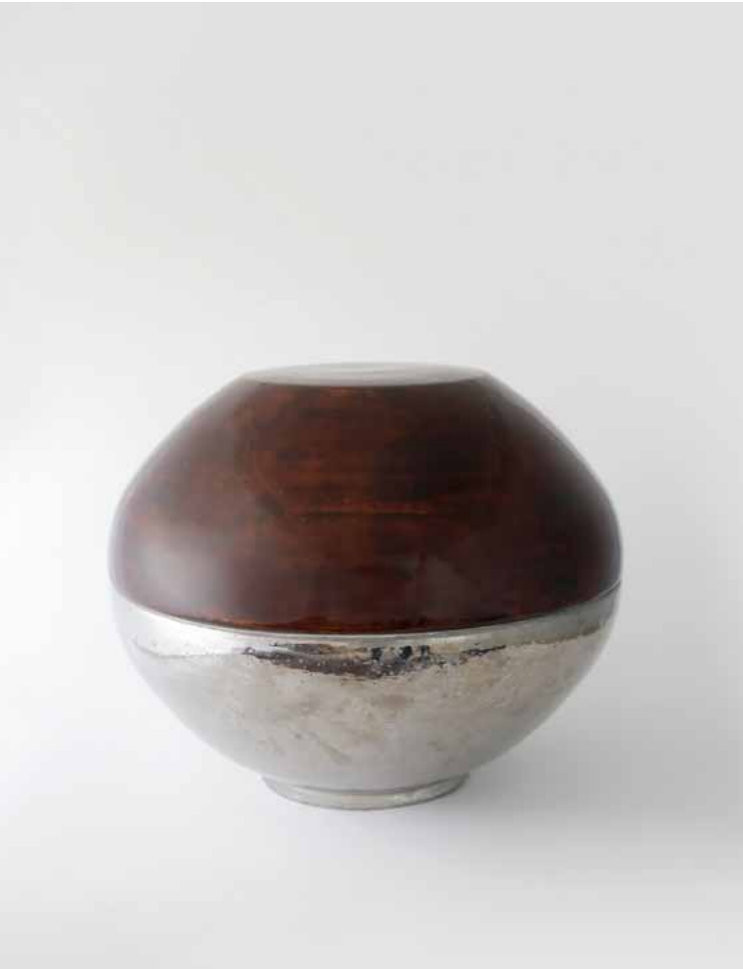
둥근 합 2 2017 점토 위에 옷칠 백토, 옷칠 50(o)X42(h)cm