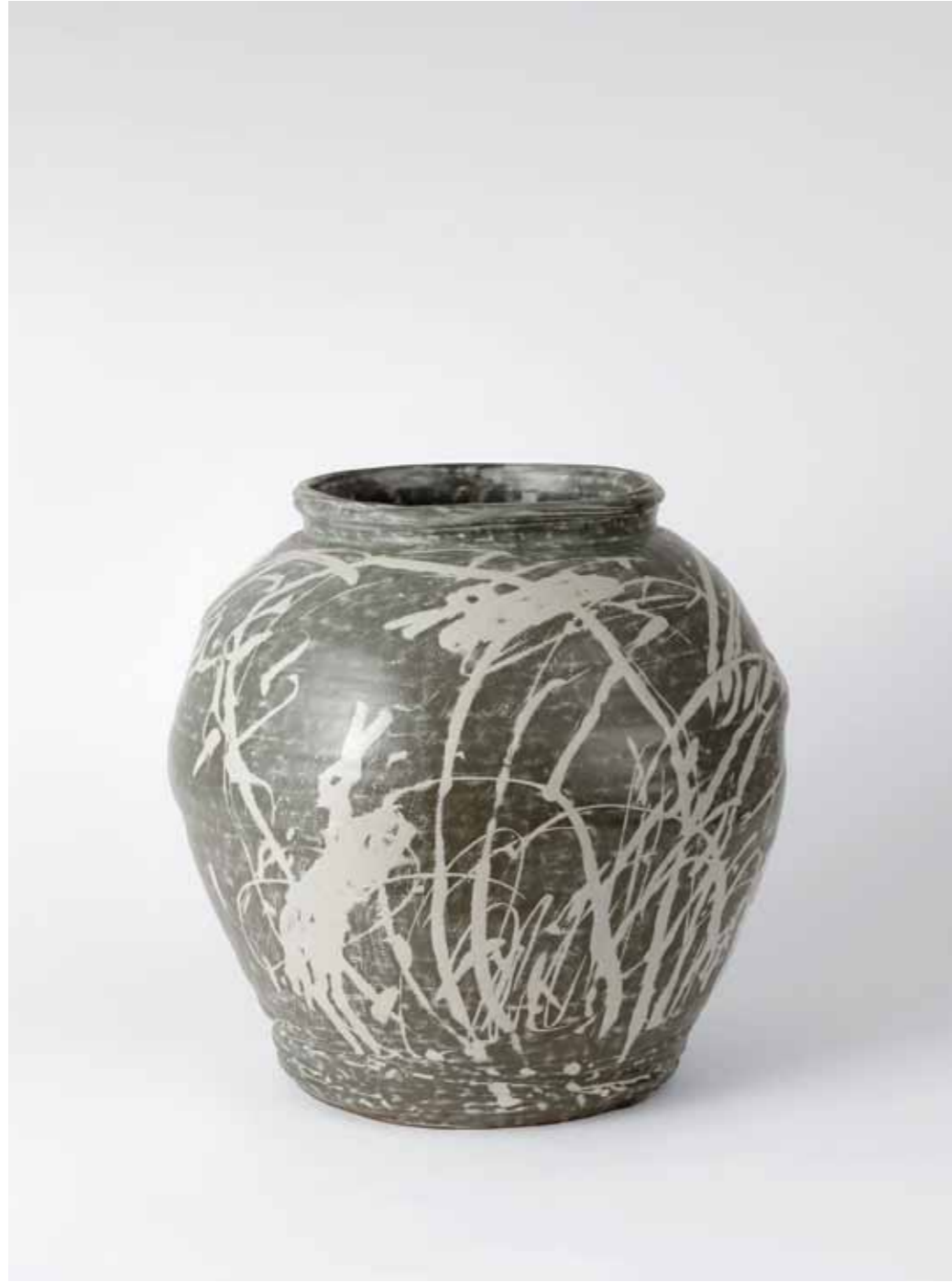
Predream Series 1991 Stoneware with stamped and inlaid decoration using white slip under transparent glaze Reduction firing 37(ø)X39(h)cm