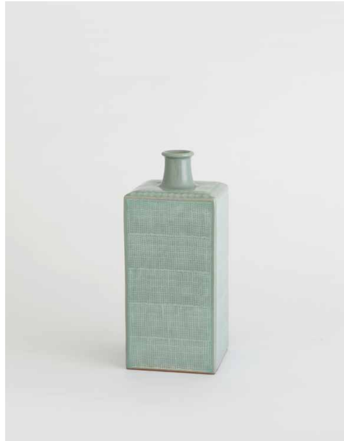
Celadon Angular Bottle 2000 Stoneware with stamped and inlaid decoration under celadon glaze Reduction firing 10.5X10.5X25(h)cm