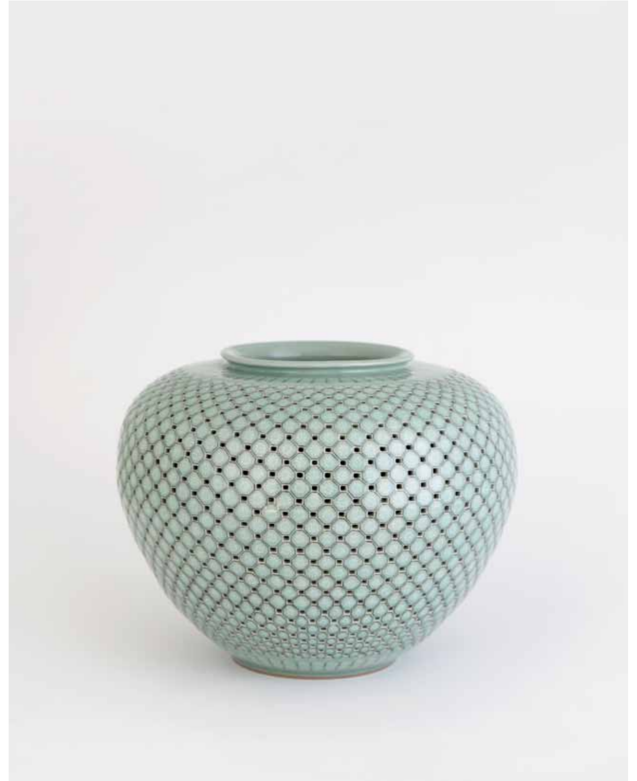
청자 상감 국화 거북문 이중 투각 호 2011 국화 인화문 장식, 이중 투각, 상감 기법 청자토, 청자 유약, 환원 소성 40(ø)X30(h)cm