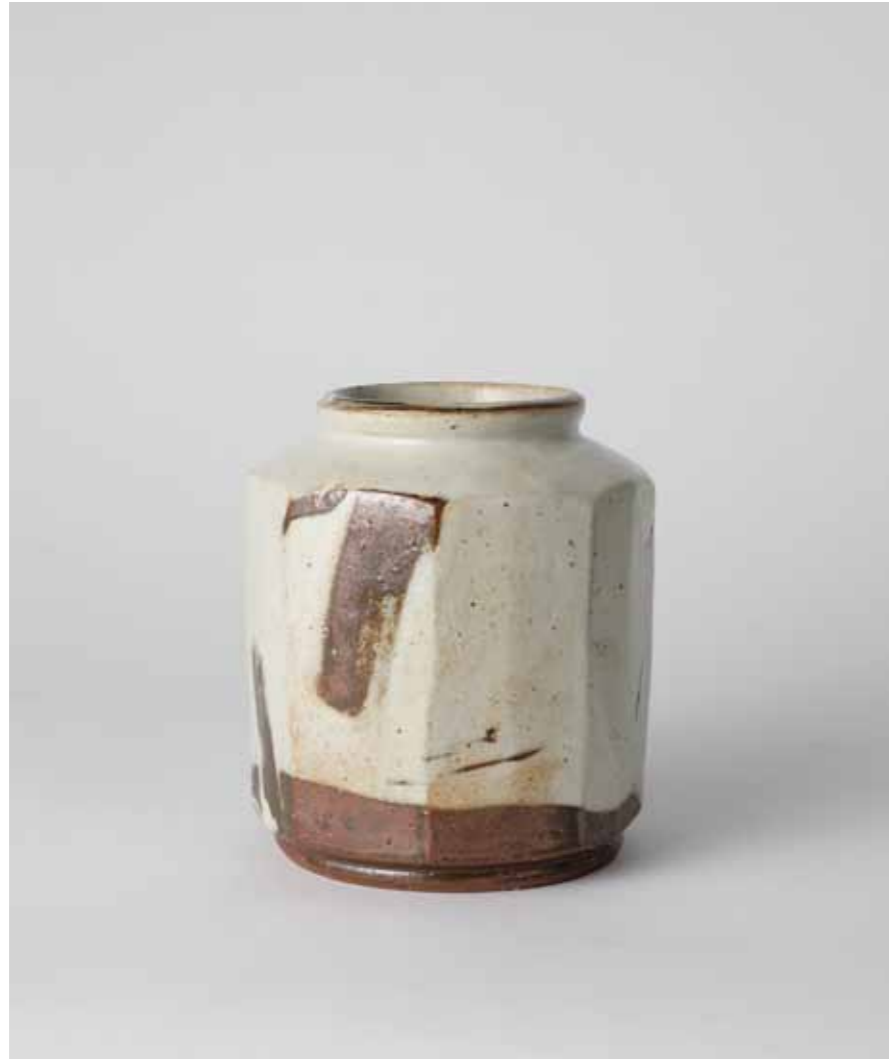
Buncheong Faceted Jar 2010 Stoneware covered with white slip and marks made with finger and duck decoration under transparent glaze Reduction firing 17(o)X16.5(h)cm

분청 면취 호 2010 수화문 장식, 분장 기법 분청토, 화장토, 투명 유약, 환원 소성 17(o)X16.5(h)cm