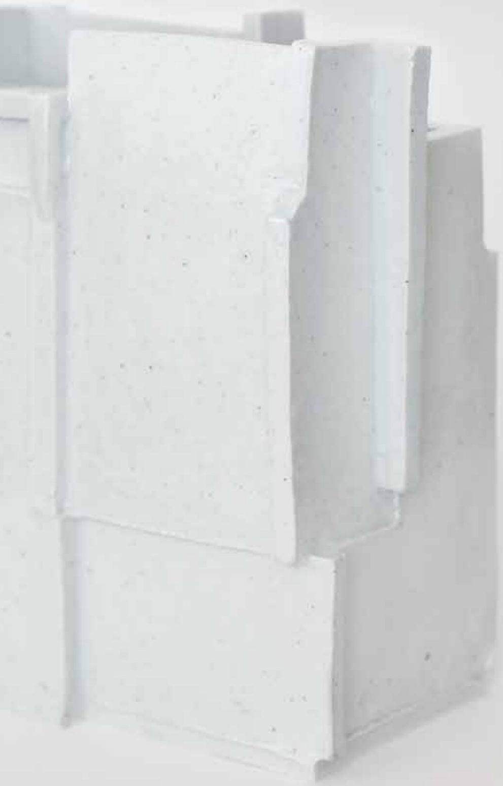
Rectangular Vessel 2017 Porcelain, transparent glaze Reduction firing 42.5X22.5X15(h)cm