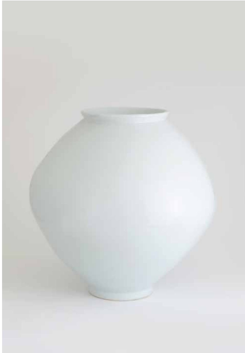
Porcelain Moon Jar 2010 Porcelain, transparent glaze Reduction firing 44(ø)X44(h)cm 백자 달항아리 2010 백토, 투명 유약, 환원 소성 44(ø)X44(h)cm