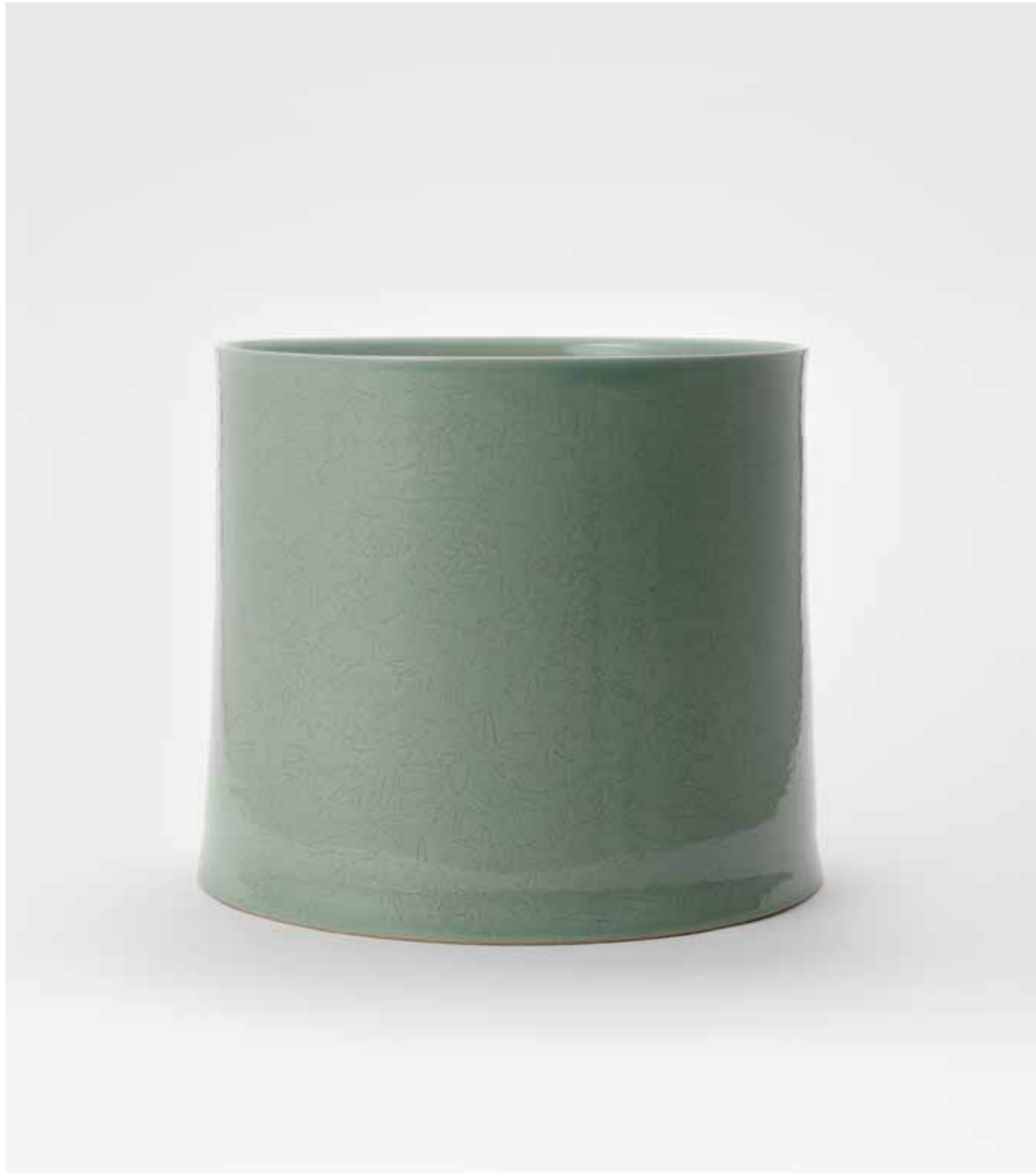
백자 초문 대발 2012 음각 장식 백토, 투명 유약, 환원 소성 36(ø)X34(h)cm