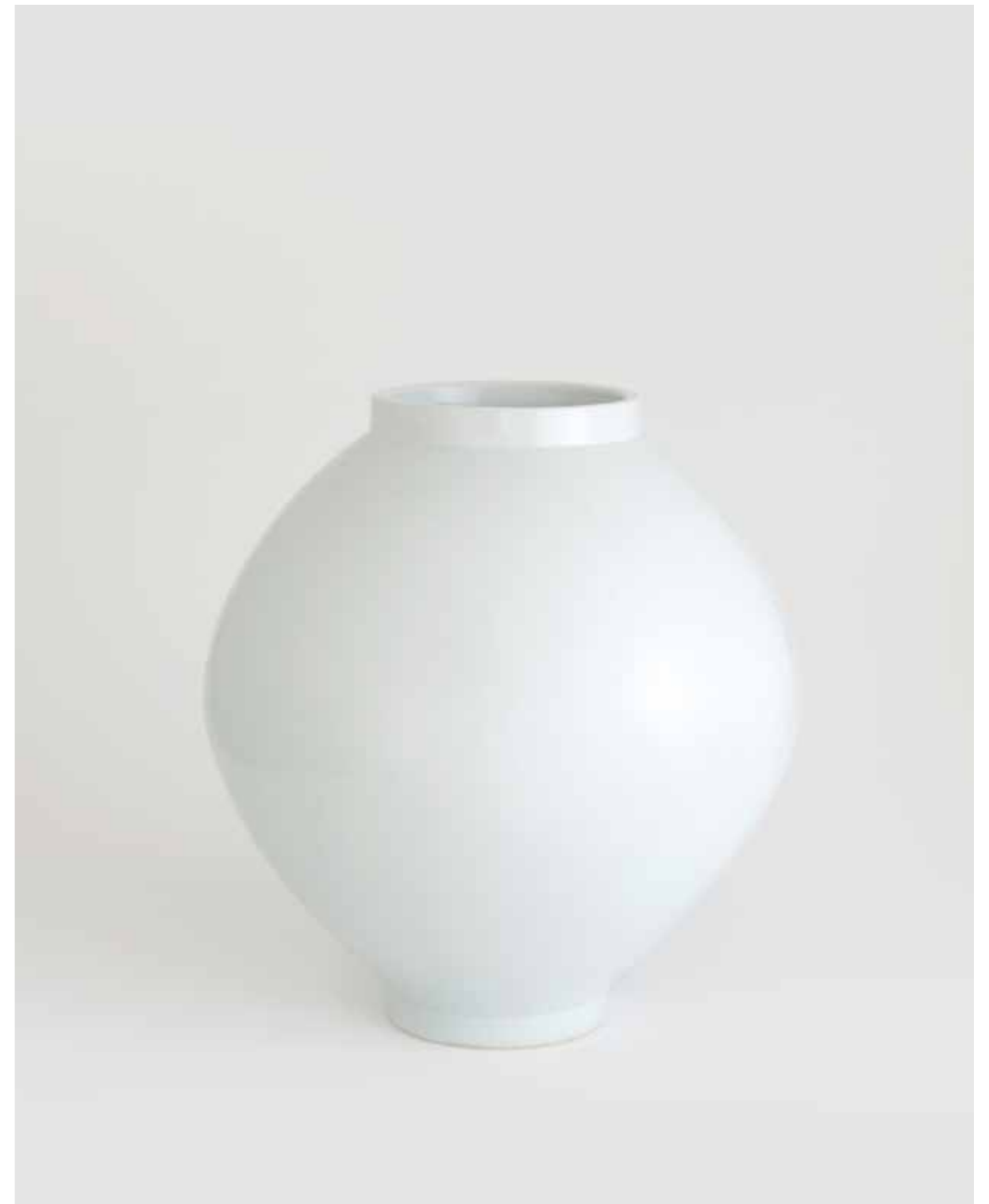
Porcelain Moon Jar 2010 Porcelain, transparent glaze Reduction firing 47(ø)X47(h)cm