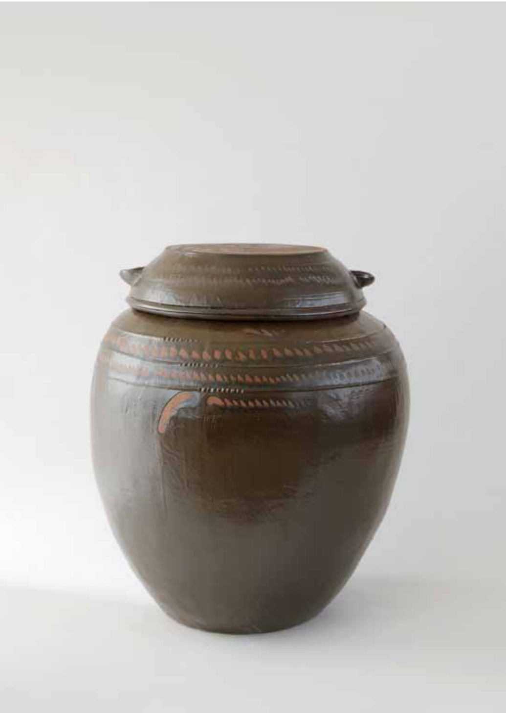
Onggi Jar with Flat-topped Lid 2017 Onggi clay, ash glaze, finger drawn wave decoration Reduction firing 70(ø)x82(h)cm