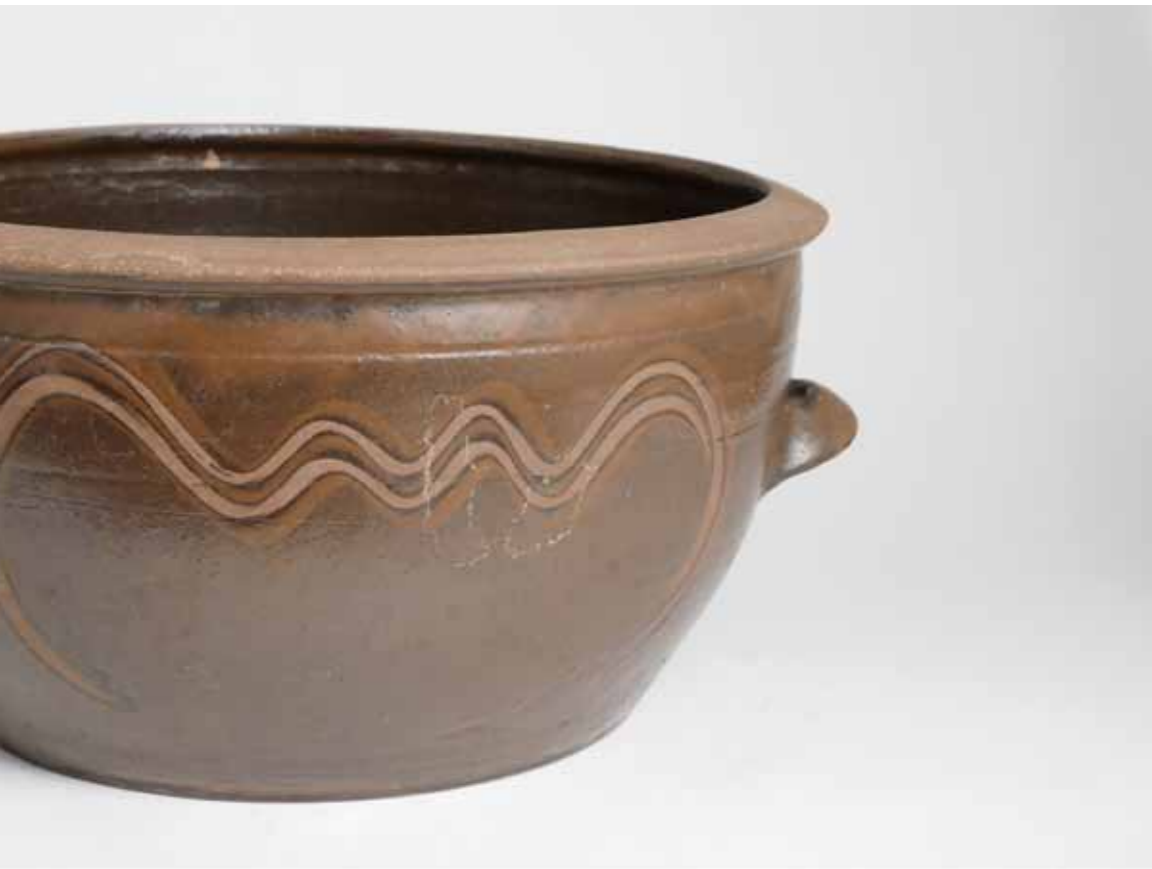
Onggi Carrier for Objects and Water 2016 Onggi clay, ash glaze Reduction firing 41(ø)X21(h)cm