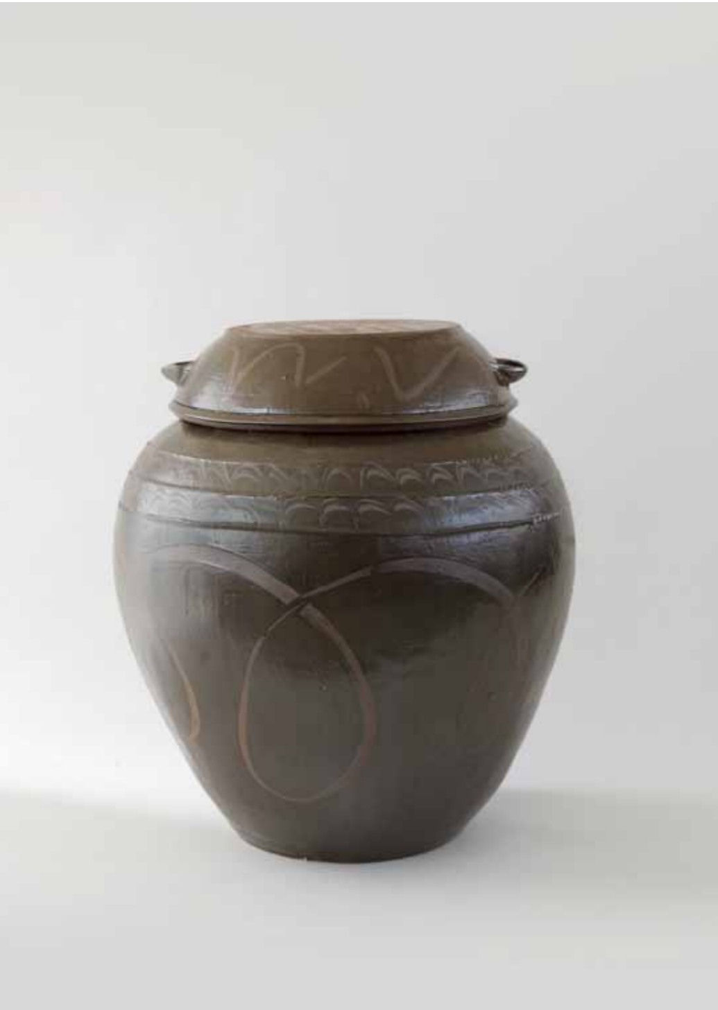
Onggi Jar with Flat-topped Lid 2017 Onggi clay, ash glaze, finger drawn swirling decoration Reduction firing 69(ø)X83(h)cm