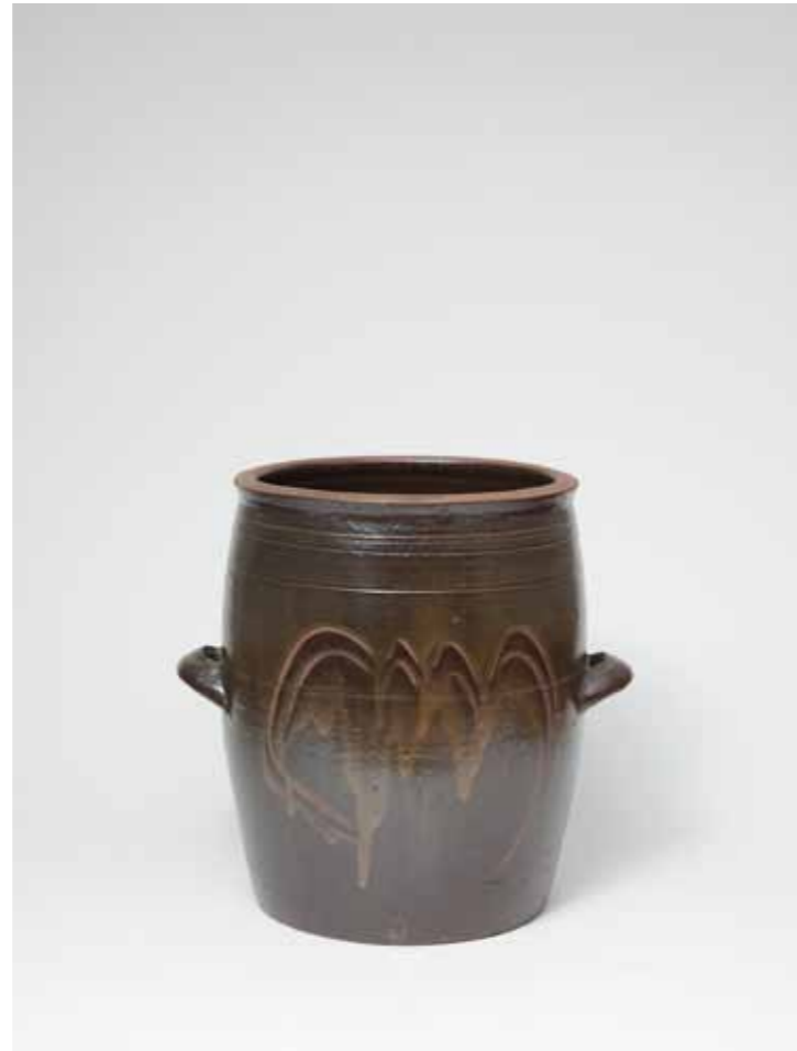
Onggi Water Holder 2015 Onggi clay, ash glaze, finger drawn surface decoration Reduction firing 26(ø)X31(h)cm