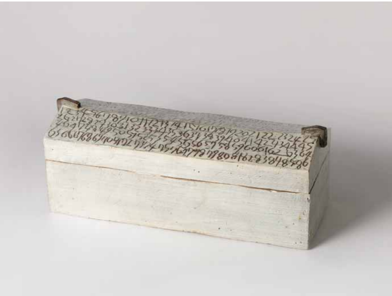
Stuffed Remembrance 2011 Stoneware decorated with white slip and incised under transparent glaze Reduction firing 60X24X34(h)cm