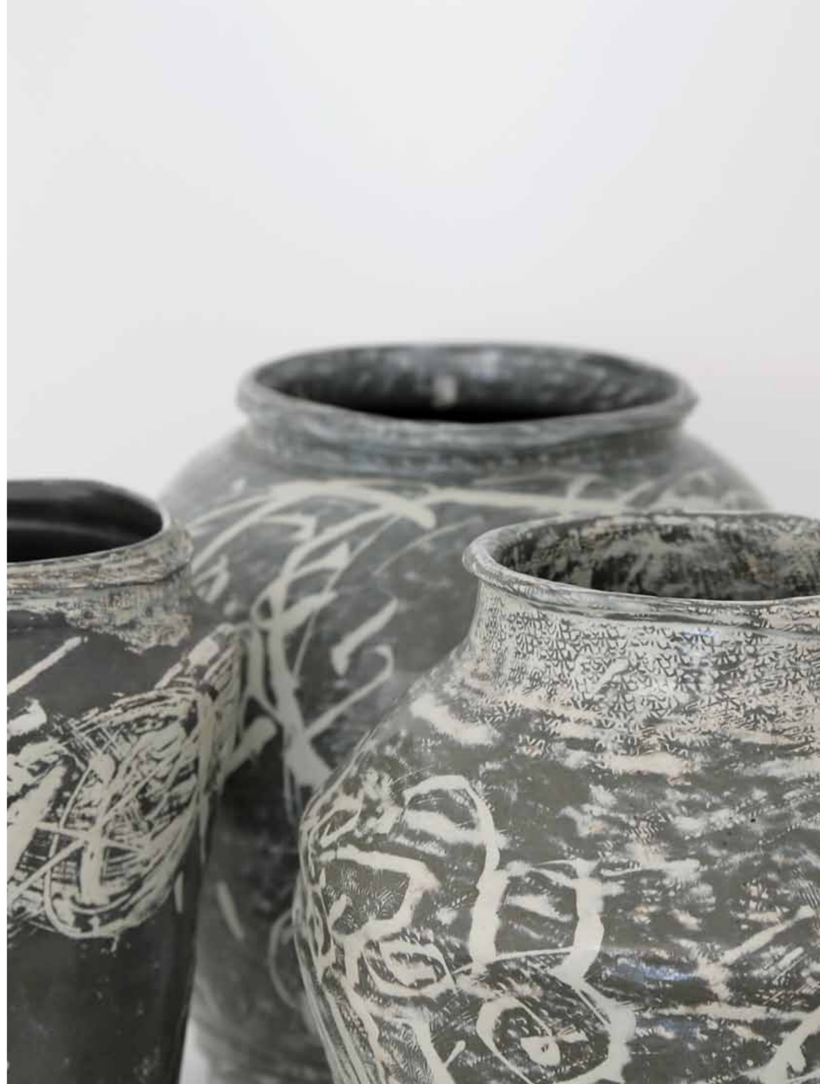
프리드림 시리즈 1991 인화문 장식, 상감-분장 기법 분청토, 화장토, 투명 유약, 환원 소성 56X50X9(h)cm