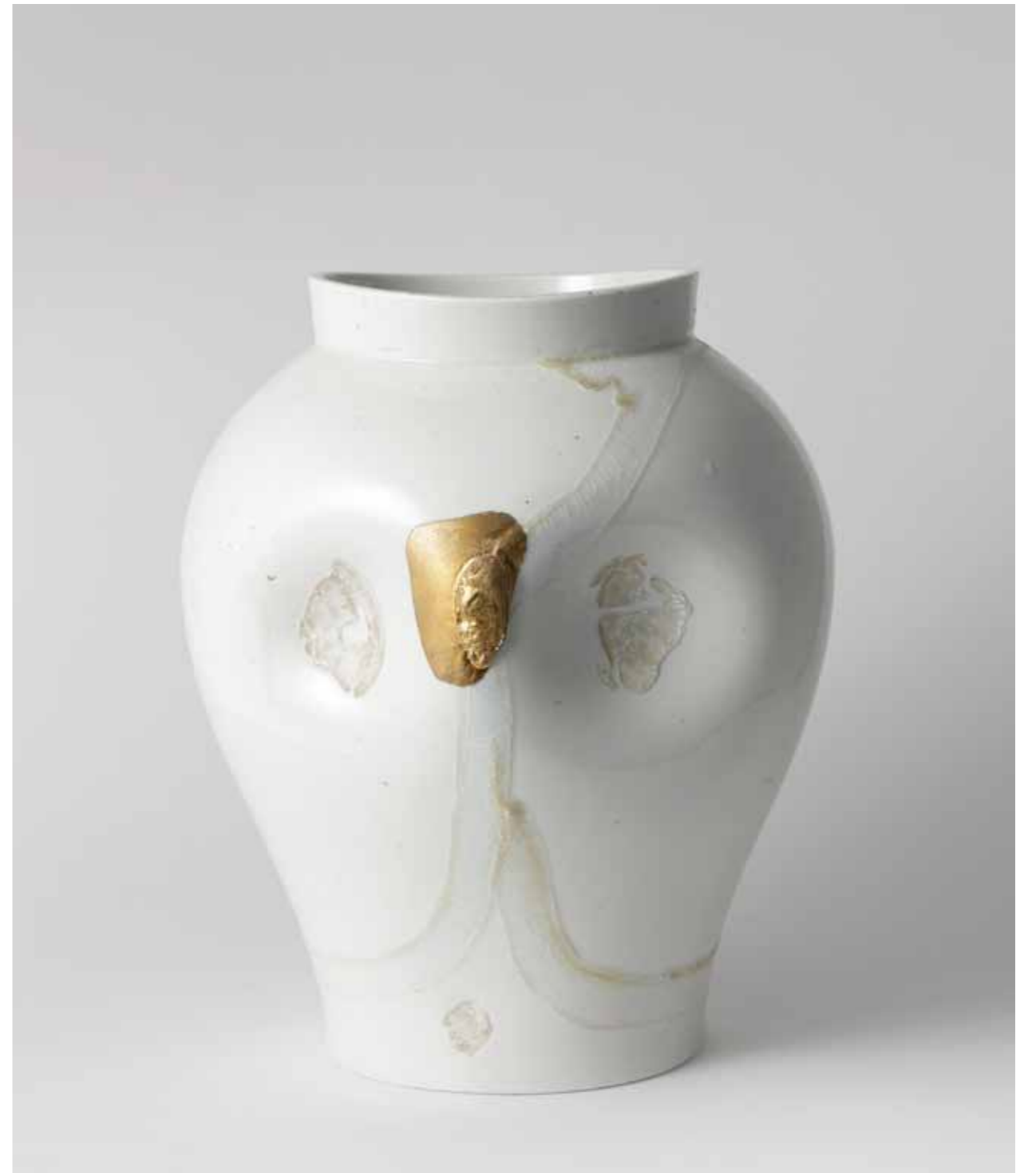
항아리 2 2014 백토, 금 장식, 투명 유약 환원 소성 29(ø)X35(h)cm