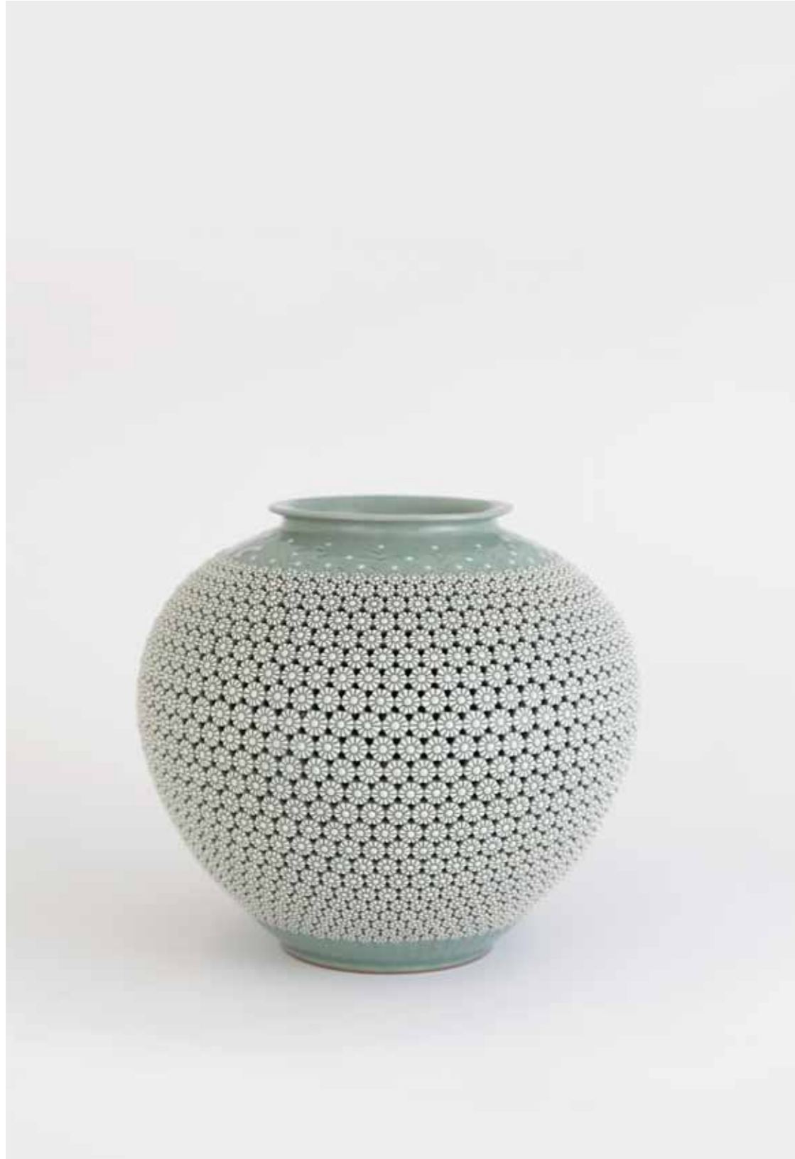
Celadon Chrysanthemum Double-walled Vessel 2005 Stoneware with stamped openwork decoration under celadon glaze Reduction firing 35(ø)X33(h)cm