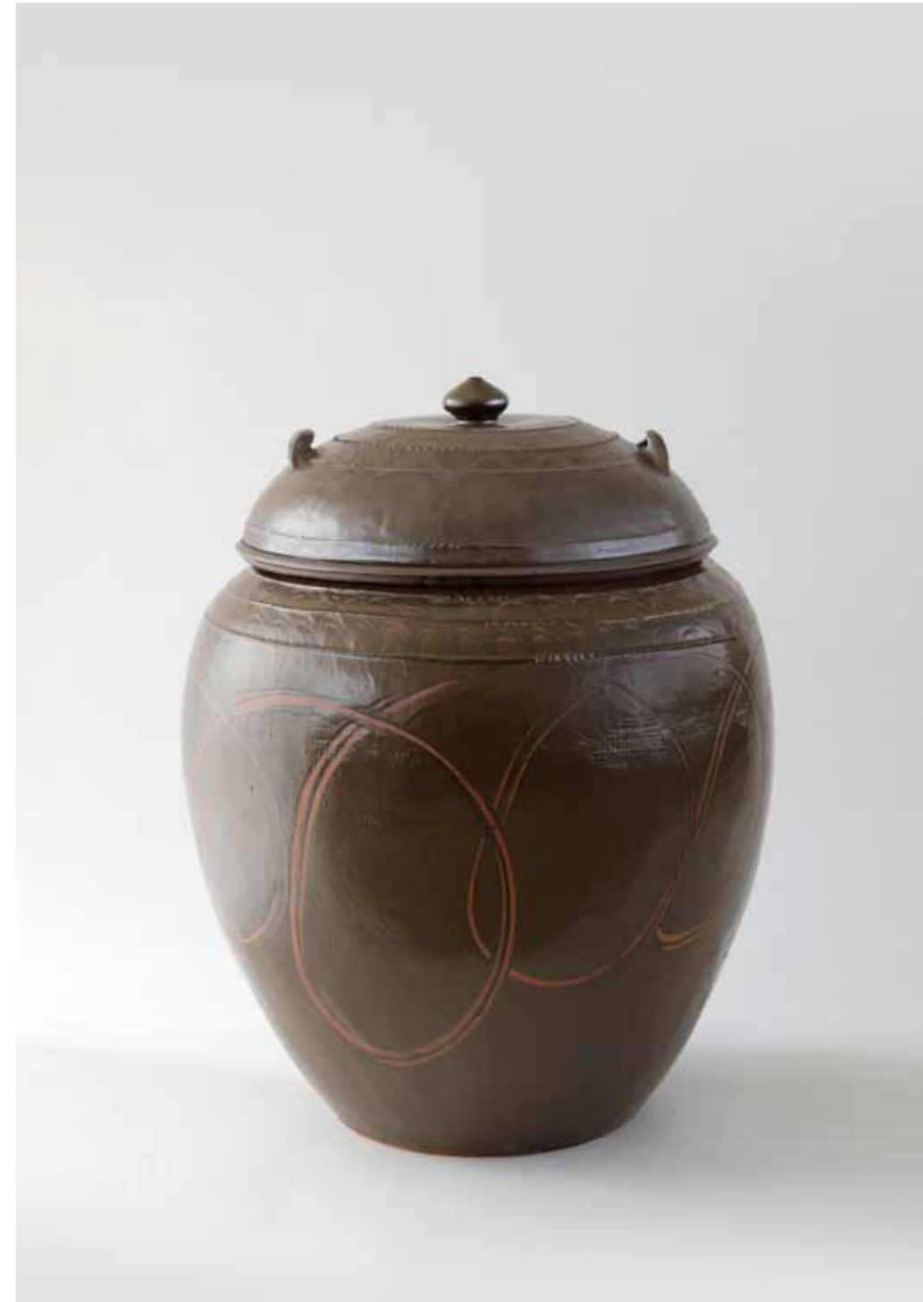
Onggi Jar with Lotus-bud Lid 2017 Onggi clay, ash glaze, finger drawn swirling decoration Reduction firing 69(ø)x83(h)cm