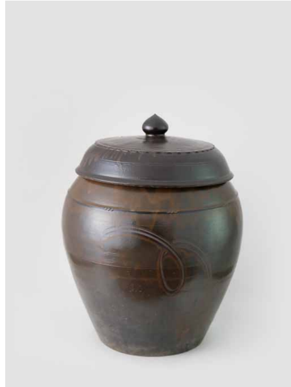
Onggi Jar with Lotus Bud Lid Handle 2016 Onggi clay, ash glaze, finger drawn surface decoration Reduction firing 50(ø)X54(h)cm