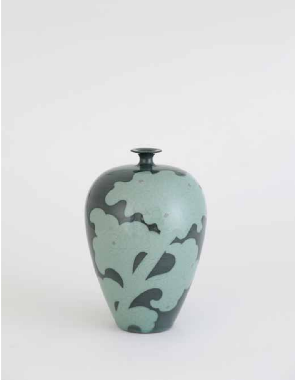
Long Celadon Bottle with Peony Decoration 2015 Stoneware with inlaid peony decoration in iron oxide under celadon glaze Reduction firing 18(ø)X30(h)cm