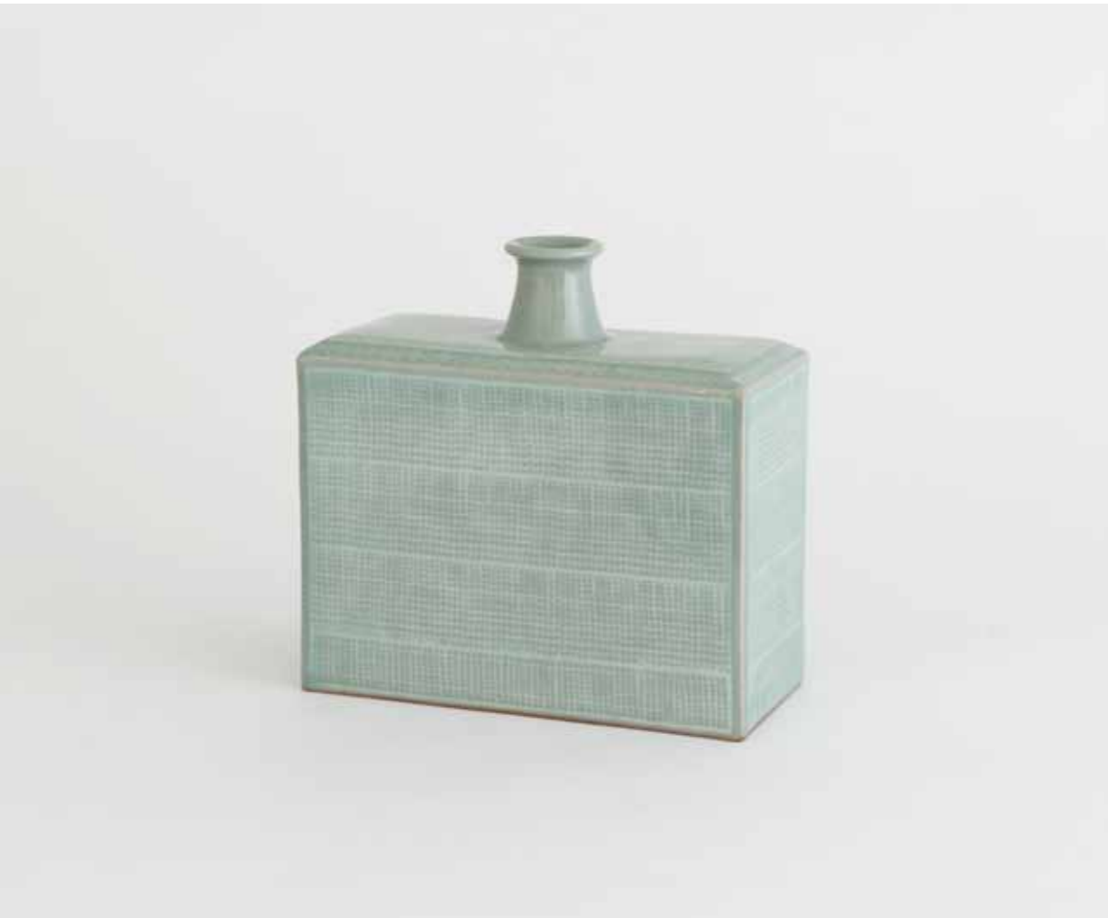
Celadon Angular Bottle 2000 Stoneware with stamped and inlaid decoration under celadon glaze Reduction firing 19.5X9X19.5(h)cm