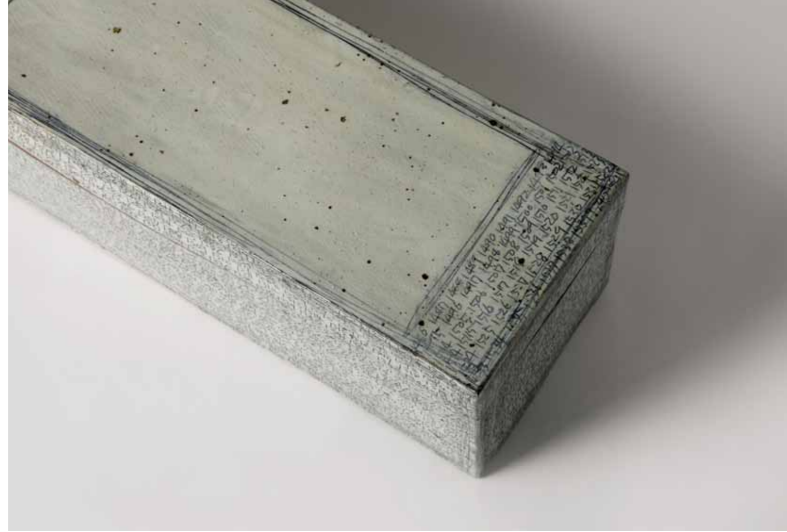
박제된 기억 2011 음각 장식, 분장 기법 분청토, 화장토, 투명 유약, 환원 소성 50X20X20(h)cm