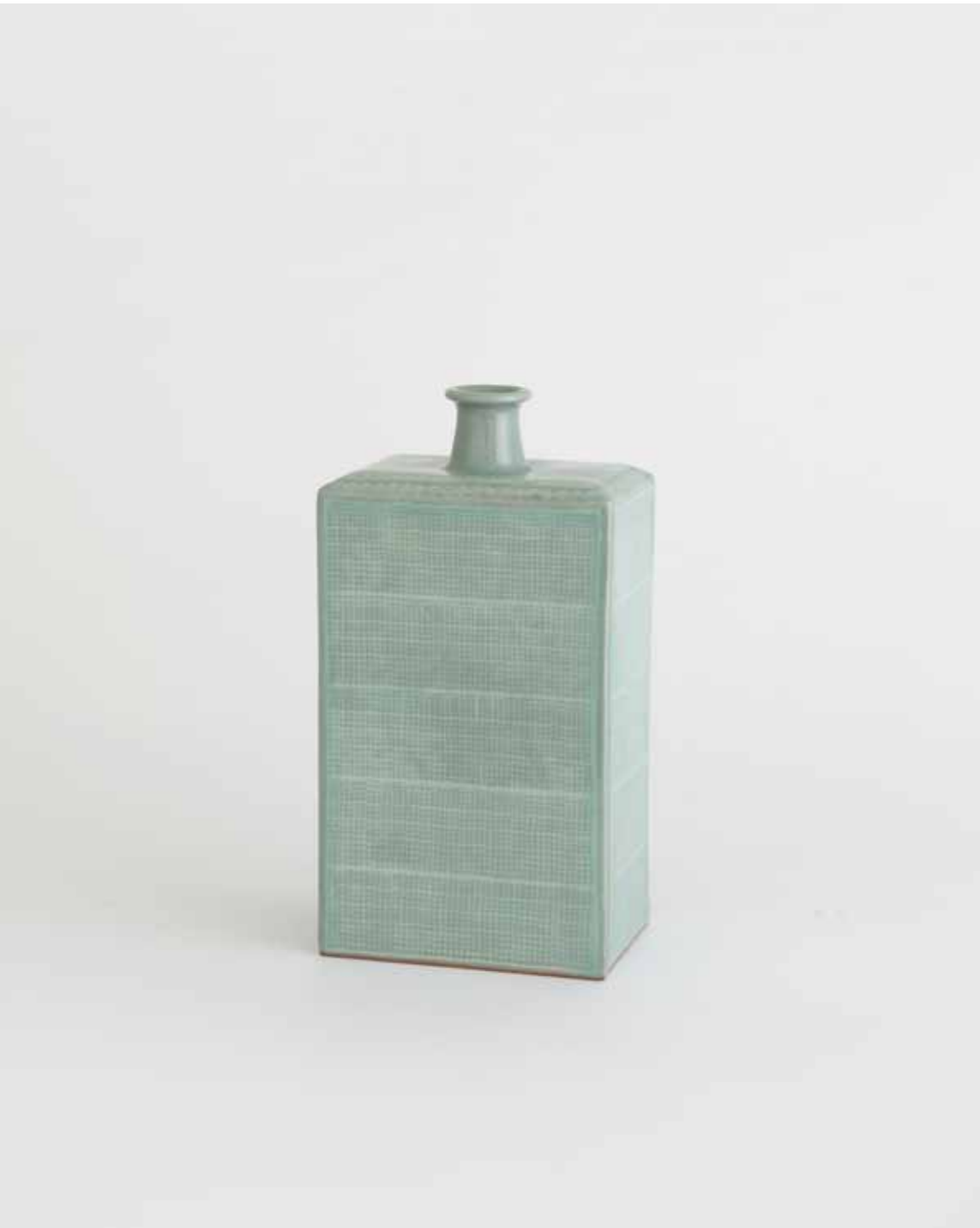
Celadon Angular Bottle 2000 Stoneware with stamped and inlaid decoration under celadon glaze Reduction firing 12.5X9X24.5(h)cm