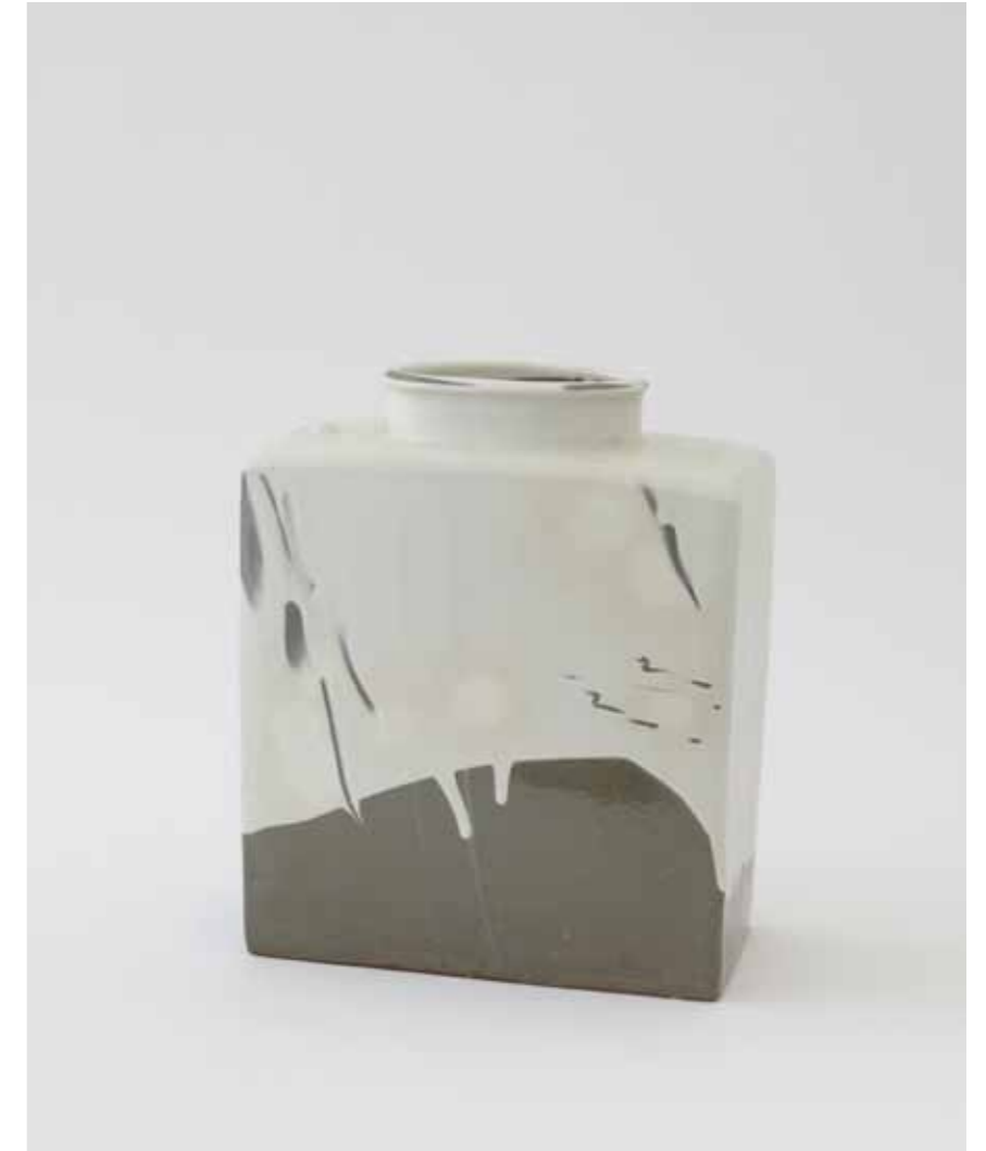
Buncheong Jar 2008 Stoneware covered with white slip and marks made with finger and duck decoration under transparent glaze Reduction firing 28×14.5×33.5cm