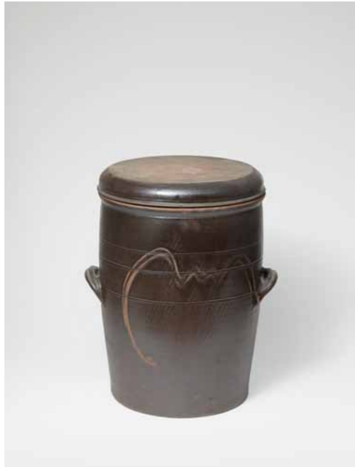
Onggi Jar for Growing Bean Sprouts 2016 Onggi clay, ash glaze, finger drawn surface decoration Reduction firing 28(ø)X36(h)cm