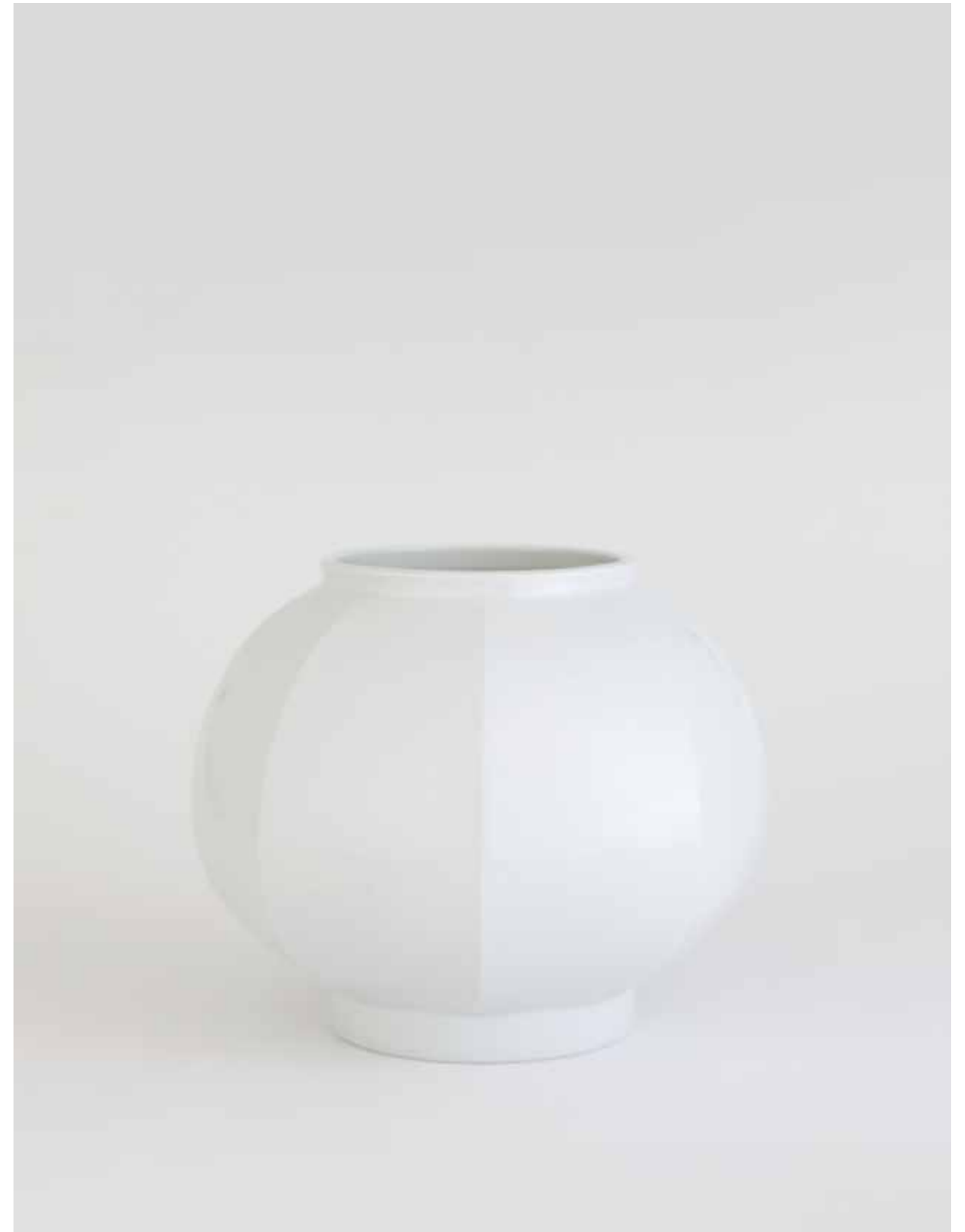
Porcelain Faceted Jar 백자 면치기 항아리 2017 2017 Porcelain, transparent glaze 백토, 투명 유약, 환원 소성 Reduction firing 25(ø)X23(h)cm 25(ø)X23(h)cm