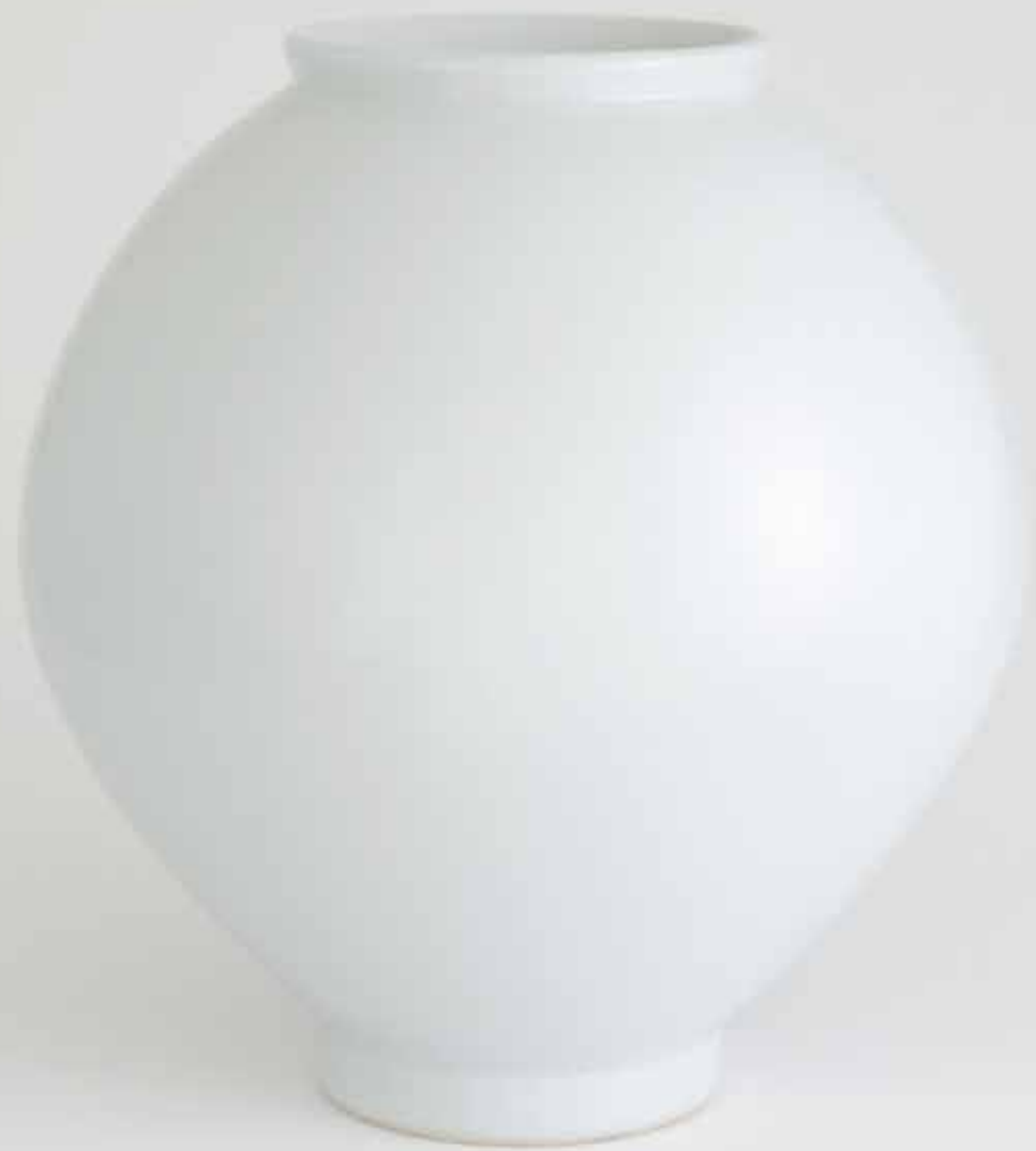
Porcelain Moon Jar 2005 Porcelain, transparent glaze Reduction firing 50(ø)X55(h)cm