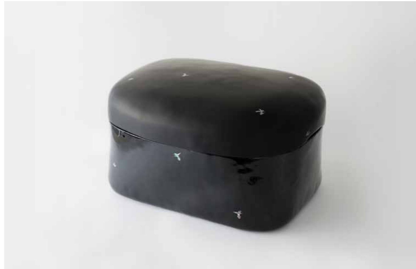
Rectangular Box 2017 Stoneware covered with ottchil and mother-of-pearl 47X39X29(h)cm