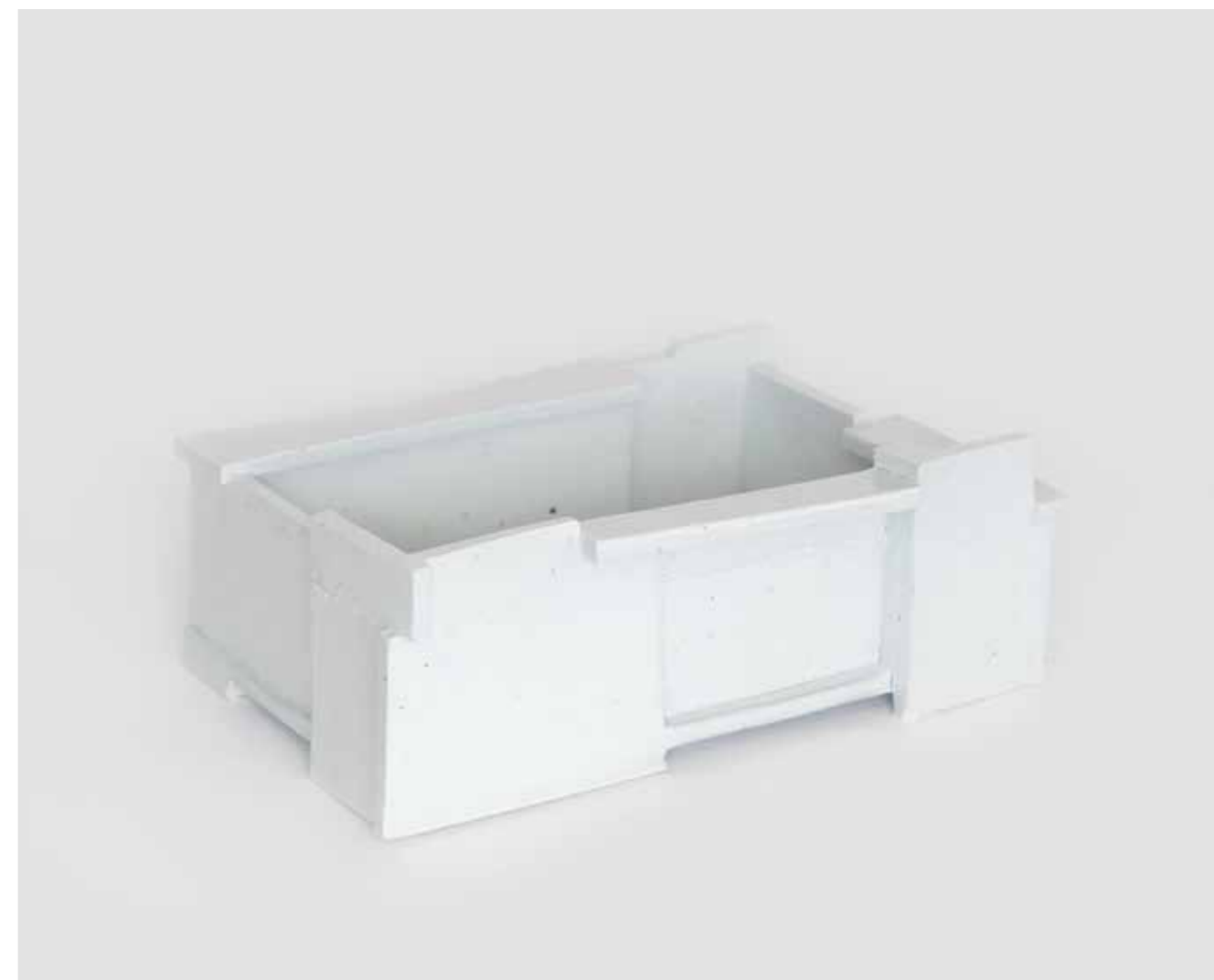
Rectangular Vessel 2017 백토, 투명 유약, 환원 소성 42.5X22.5X15(h)cm