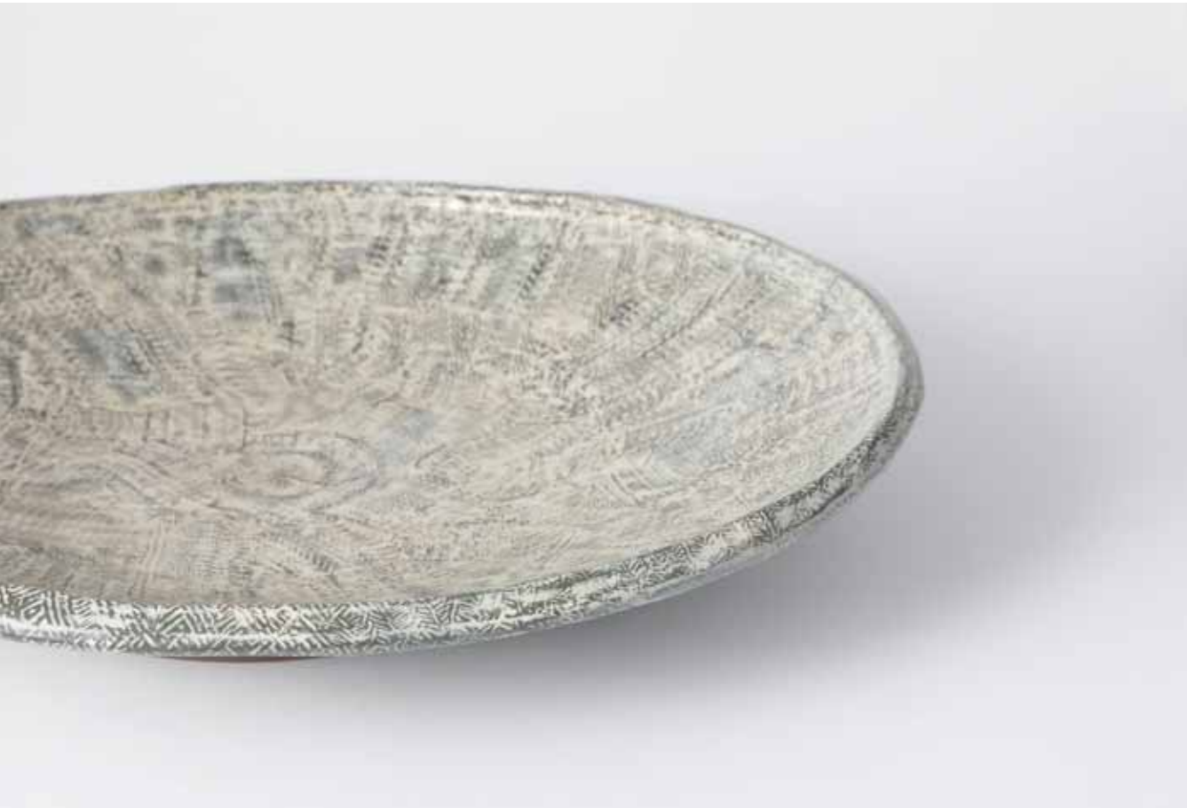
Predream Series 1991 Stoneware with stamped and inlaid decoration using white slip under transparent glaze Reduction firing 56X50X9(h)cm