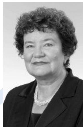
Prof. Dr. Dagmar Schipanski Präsidentin der Deutschen Krebshilfe

„Deutsche Krebshilfe“ ist eine eingetragene Marke (DPMA Nr. 396 39 375)