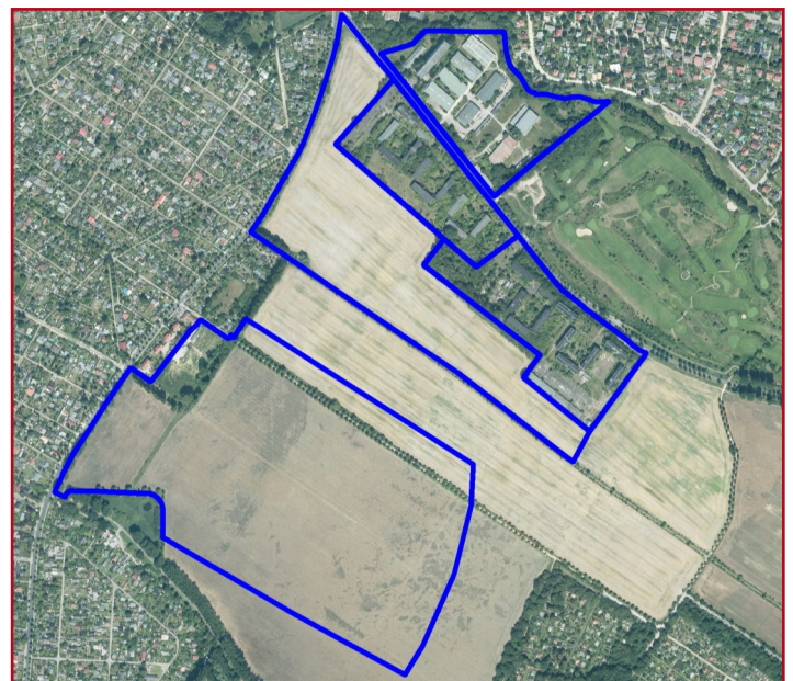
Luftbild Blankenburger Pflasterweg / Heinersdorf, Berlin-Pankow