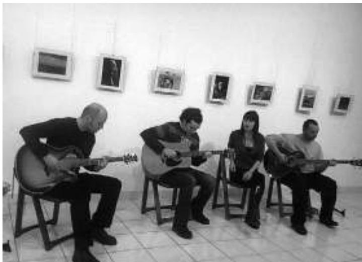
Зоз вистави фотографийох з конкурсу "Людзе"