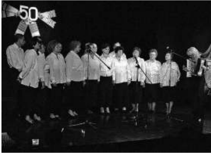
Наступ мишаней шпивацкей групи у Кули на означованю 50 рокох парохії св. священомученіка Йосафата 2006. року