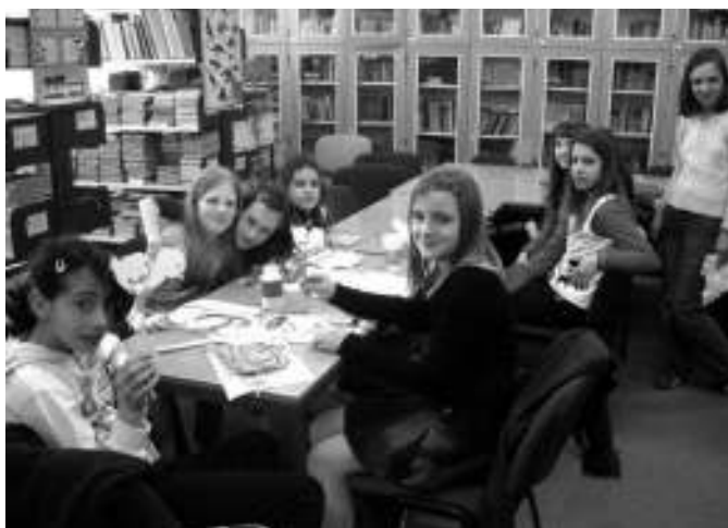
Стретнуце школярох хтори факултативно виучую руски язык зоз Нового Орахова и Кули

Кажди рок ше организую и Стретнуца руских школах, пре лепшу комуникацию школярох и наставнікох руского. Таке Стретнуце, осме по шоре, отримане и у Кули 2002. року.