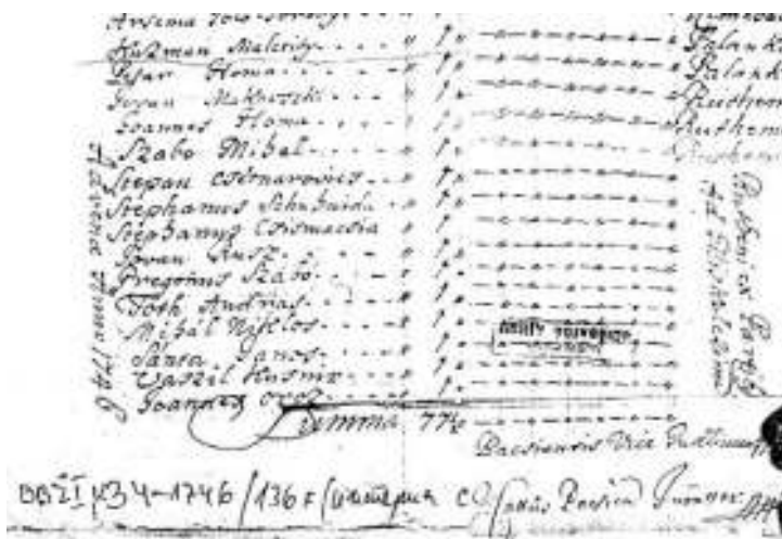
Ксерокс оригиналногo попису зоз 1746. року

У першим Попису керестурского жительство зоз 1752. року записане же зоз Кули до Велького Керестура преселели 18 фамилии, зоз других местох 1751. року преселели 13 фамилии и у 1752. року до Велького Керестура преселели ише 29 фамилии.