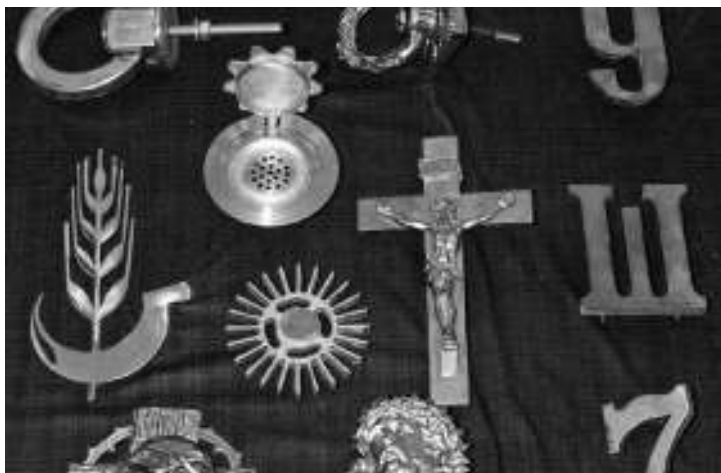
Часц уметніцких продуктох зоз офарбеного металу