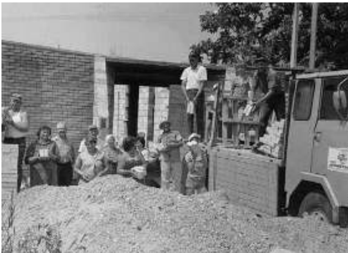
У будованю церкви участвовали велї парохияне