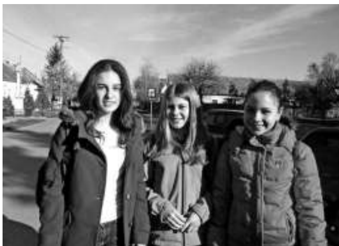
Учасніці змаганя з руского языка з Кули

но оцена з руского не уходзи до общего успиху та школяре не барз мотивовани за таку наставу. Єден з мотивох то дипломи на змаганьох з руского языка, хтори школяром приноша одредзени боди за упис до штредней школи, а ту и пенєжни стимуляції СО Кула хтори ше розписую кажди рок. Змаганя организує Дружтво за руски язык, литературу и культуру.