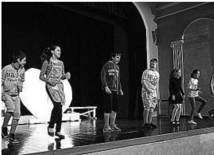
Зоз премиєри представи "Маче, любим це як цо качка люби каче"